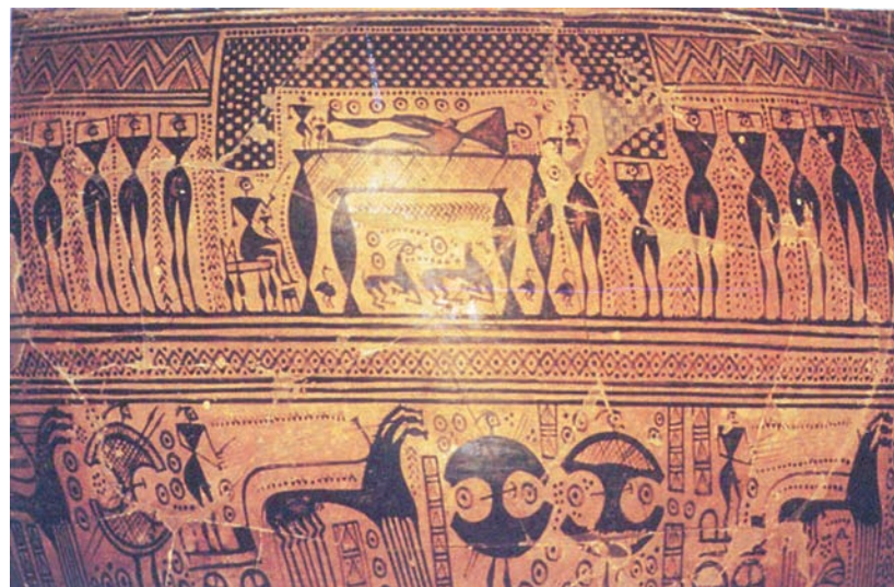
Prikaz pogrebne povorke (ekphora)

Grci su smatrali da proces prelaska s jednog svijeta u drugi obvezno mora proći tri različita stupnja: prvi je fizičko umiranje, drugi biti mrtav, ali nesahranjen, a treći biti mrtav i pokopan čime je čin prelaska uspješno okončan.