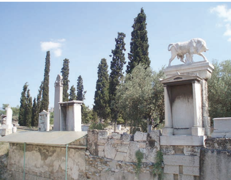
Moderne kopije antičkih pogrebnih spomenika u Ateni

Prema Homeru, mrtvi se od živih razlikuju po nedostatku snage i taj nedostatak glavni je razlog njihove nemogućnosti utjecaja na zemaljske događaje. Homer sugerira i da je sigurnije poštovati potrebe umrloga i propisno ga pokopati, ali ako se to ne obavi, živući riskiraju samo osvetu bogova, ali ne i osvetu tog pokojnika, što govori u prilog njihovoj nemoći. Mrtvima nije oduzeta