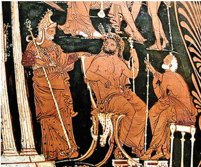
Prikaz triju sudaca u Hadu

Prema kršćanskom učenju, ono što slijedi nakon smrti utjeha je za sva zla pretrpljena tijekom života, pogotovo u slučaju mučenika koji su umrli u obranu svoje vjere. U poganskim religijama nije bilo mučenika. Premda su pojedinci umirali zbog obrane svojih principa, primjerice književna junakinja Antigona i filozof Sokrat, oni su to činili isključivo zbog sebe, bez ikakve teološke pozadine ili božanskog primjera koji su slijedili. I premda su Grci i Rimljani u svojim vjerovanjima pošteđeni strahota kršćanskog pakla, uskraćena im je i utjeha boljeg života nakon smrti pa je stoga teško zamisliti da su pozitivno razmišljali o boravku u Hadu. Vjerovanje u sistem nagrade i kazne u zagrobnom životu nije postojao jer su i dobro i zlo počinjeni na ovom svijetu vodili jednakom neveselom životu u Hadu. Poznati grješnici, Tantal, Sizif i Titije, nisu kažnjeni zbog nekog zločina koji su počinili na zemlji, već zato što su uvrijedili dostojanstvo bogova pa su strašno kažnjeni i kao primjer i kao iznimka od pravila. Had je bio naziv i za boga podzemnog svijeta i za njegovo kraljevstvo. Had je također i jedno od tri područja svijeta kojim vlada samo jedno božanstvo – skupa s Posejdom, bogom mora, Zeusom, vrhovnim bogom neba ravnopravno je vladao i Had, bog podzemlja (Garland, 188: 48-49).