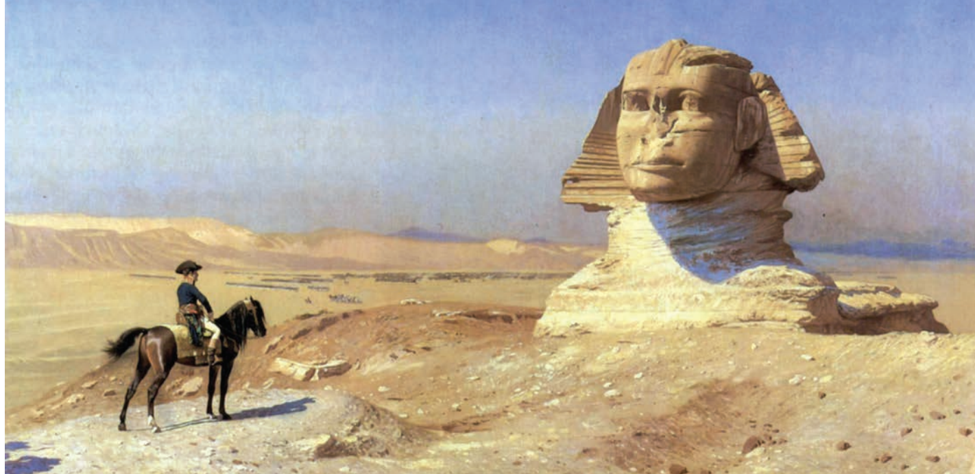
Napoleon u Egiptu