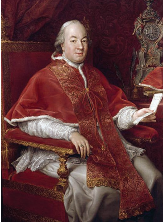
Papa Pio VI. (1775. - 1799.)

kolovoza) slavio se (kasnije) kao Napoleonov dan (jer je to i datum njegova rođenja).