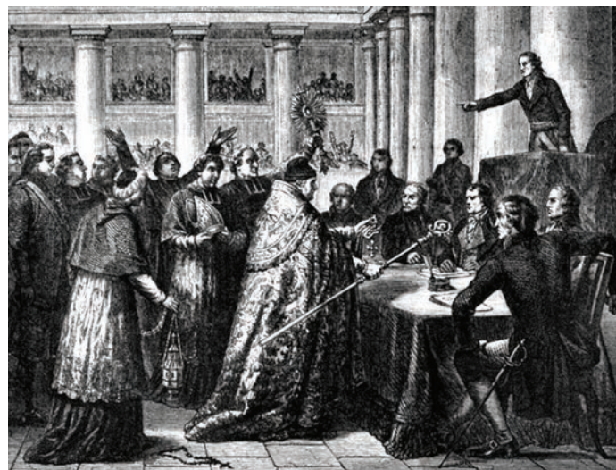
Poglavari Katoličke crkve u Francuskoj prisežu civilnu zakletvu

Razlaz s papom dogodio se zbog ratne strategije. Napoleon je zahtijevao zatvaranje talijanskih luka za britansko brodovlje, a papa nije pristao šaljući poruku kako se on ne svrstava na ničiju stranu. Napoleonu, koji je zaratio s gotovo čitavom Europom, neutralnost nije bila opcija koju je mogao prihvatiti. Postojale su samo dvije strane: ona s njegovim topovima i ona na ciljniku njegovih topova. Zauzeo je, stoga, sva papinska područja u Italiji i dao Pija VII. zatvoriti u kućni pritvor. Zadnja odluka Pija VII. je ekskomunikacija svih svećenika ili biskupa koji se priklone Napoleonu. Dokument kojim se potvrđuje ta odluka Napoleon je pokušao uništiti ili barem spriječiti da dođe do Pariza. Tajnim kanalima ona je ipak dospjela u francuski glavni grad. Napoleon je napravio veliku političku pogrešku u postupanju s papom. Uvrijeđeni katolici zbog toga su potražili utočište kod progonjenih rojalista koji