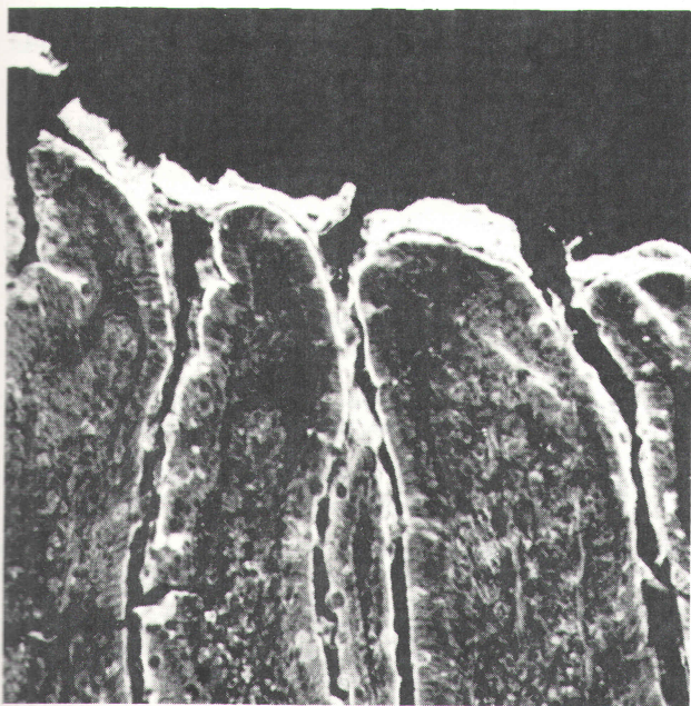
Slika 2 Histološki preparat tankog creva pacova hranjenog obrokom s 40% sirovog pasulja. Preparat je tretiran s anti-PHA antitelima konjugovanim s fluorescentnom bojom. Lektin iz obroka vezan je za površinu epitela i pokriva vrhove resica.

Figure 1 Histological preparation of villi in a pig treated by phytohaemagglutinine conjugated with fluorescent colour. Lectine is linked to the surface of the mucous epithelium.