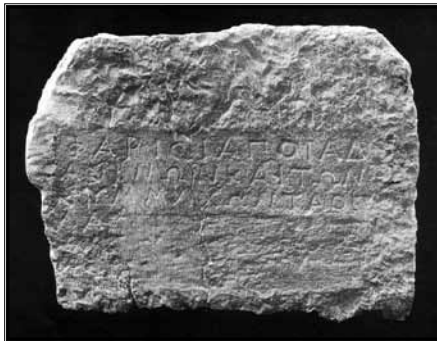
Natpis iz Farosa koji govori o pobjedi Farana nad Jadasinima i njihovim saveznicima, IV. stoljeće prije Krista

Opširnija iskapanja oko crkve sv. Ivana, koja je izvela Državna uprava za zaštitu spomenika kulture iz Splita