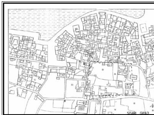
Gradsko područje Pharosa

u posljednjih dvadesetak godina, otkrila su dio istočnog grčkog fortifikacijskog zida. Zaštitna iskapanja konzervatora otkrila su dijelove grčkih kuća na više lokacija, unutar i izvan stare gradske jezgre današnjeg Staroga Grada, ali to je još uvijek nedovoljno za rekonstrukciju urbanog plana Pharosa. (1) Zasad samo znamo da su zidovi kuća napravljeni od neobrađenog kamena povezanog glinom (Jeličić-Radonić, 2010: 127).