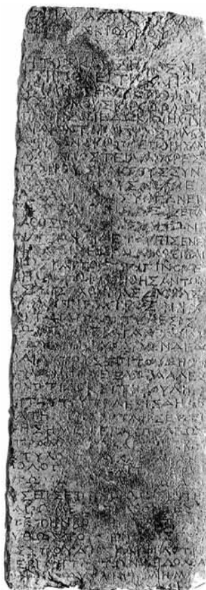
Psefizma, voljom farske skupštine izglasani dokument iz kasnog 3. stoljeća prije Krista - govori o delegaciji Farana koja je u matičnom gradu Parosu tražila pomoć u obnovi grada

Budući da su doseljenici dobili jednaku količinu zemlje i da poznati ostaci kuća u Pharosu pokazuju ujednačenost u gradnji, govori nam da su stanovnici vjerojatno bili ravnopravni u posjedu i odlučivanju, odnosno da je morala postojati demokratska organizacija. Na Parosu je dominantna institucija bila patria, a u koju su upisivani članovi stariji od 18 godina. Misli se da su postojale tri patrie koje su svake godine birale arhonta. Na Parosu i na Tasosu poznajemo i druge brojne strukture i funkcije u javnoj, vjerskoj i vojnoj sferi života. Vjerojatno je i u Pharosu moralo biti nešto slično, ali je Pharos bio deset puta manji od tih gradova i zato su u njemu neke javne funkcije bile reducirane. (1)