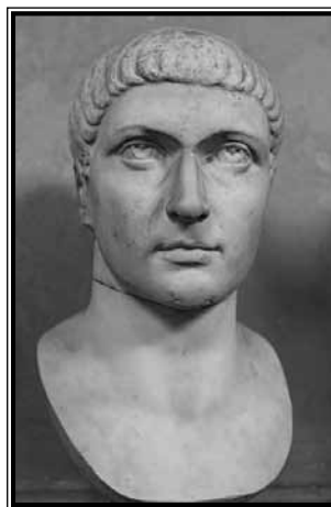
Car Konstantin Veliki (272. - 337.)