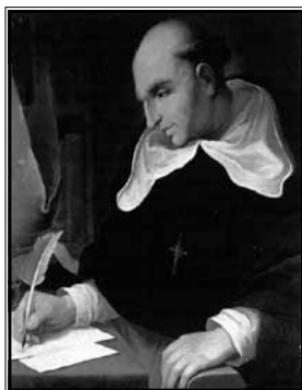
Bartolomé de las Casas (1484. - 1566.)

Vitoria je dao niz predavanja o pravima Indijanaca koji su primijenili tomizam kao kritiku španjolske vlasti. Sva ljudska bića dijele sposobnost za racionalnost i imaju prirodna prava koja potječu od ove sposobnosti. Iz ovih pretpostavki zaključuje se da papinska uloga dodjeljivanja Španjolskoj vlasti nad Americama nije bila valjana. Za razliku od stajališta pape Inocenta IV., Vitoria je tvrdio da niti papa niti Španjolci ne mogu podvrgnuti Indijance tako da bi kaznili prijestupe protiv prirodnoga zakona, kao što je bludništvo ili preljub. Papa nije imao pravo ratovati protiv nevjernika i oduzimati im vlasništvo jednostavno zato što su bili „bludnici ili lopovi“. Ako bi to