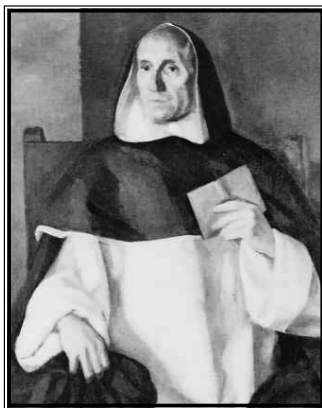
Francisco de Vitoria (1483. - 1546.)