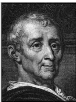
Montesquieu (1689. - 1755.)

zakonima, dok u despocijskoj vlada pojedinac bez zakona i pravila, naprosto prema svojoj volji i ćudi. Postavljanje ovakvih monarhijskih vladavina s ustavom ili s druge strane parlamentom, pokazatelj je koliko je tadašnje britansko državno uređenje i popratne revolucije koje su ga stvorile imalo utjecaj na razmišljanje tadašnjega doba. Kasniji će tek prosvjetitelji razviti i isticati ideju o vladavini cijeloga naroda. U pogledu načela vladavine krepost se smatra načelom republikanske, čast načelom monarhijske, a strah načelom despocijske vladavine. Politička sloboda nije moment potpunog slobodnog činjenja, nego činjenje onoga što od nas zakon zahtijeva. Jamstvo političke slobode ovisi od pravilnoga zakonodavstva u nekoj državi. U analizi engleskog ustava Montesquieu razvija, pod već spomenutim utjecajem Lockea, svoju poznatu teoriju o podjeli triju vlasti, zakonodavne, izvršne i sudske, koja je toliko odlučno djelovala na suvremenike i na cijelo stoljeće pa i do današnjih vremena. U religiji se zahtijeva stroga vjerska snošljivost, jednakost svih vjera pred zakonom jer to