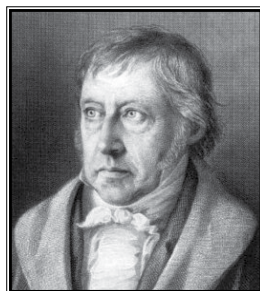
Georg Wilhelm Friedrich Hegel (1770. - 1831.)

The colonization of the continent of America greatly differs from any other colonization in history. Colonization of North America was primarily a colonization of inhabiting new areas by the European population. On the other hand, South America was colonized by the people of Spain and Portugal. Although all types of colonization (inhabitation, trading, conquering) in themselves poses characteristics of the other two types, one of them is usually more dominant than the others. Another major difference separating this particular colonization is that it produced a cultural clash of civilizations that were heavily contrasted to one another. Comparison between these two civilizations as well as pointing out their mutual differences serves a purpose of further explanation of the special position of the colonization of America. It is important to emphasize that, when talking about the "theory" in this article about the colonization of America, the view of the state of society and worldview is presented by the spirit of the time of thinkers from Hegel to Casas.