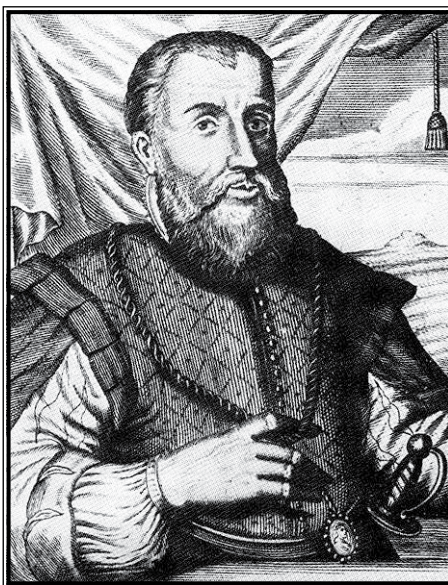
Diego Velasquez (1465. - 1524.)

Za vrijeme svojeg boravka na Kubi Cortés se uzdigao na društvenoj ljestvici, ali još nitko nije mogao slutiti koje će razmjere dosegnuti njegovi podvizi. On sam bio je osoba niska rasta, visok svega 160 cm, s malom glavom i širokim prsima te je bio i mršav, pomalo pognut, blijede puti i smeđe kose. Njegov mentor Velasquez organizirao je ekspediciju na poluotoku Yucatan sa svrhom trgovine i organiziranja naselja, ali je ona pod vodstvom Juana de Grijalve propala zbog nemogućnosti sporazumijevanja i otpora domorodaca. Na čelo nove flote postavljen