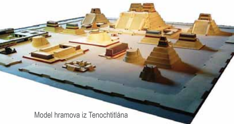
Model hramova iz Tenochtitlána

U središtu grada nalazio se Veliki hram, umjetna planina na čijem su vrhu postojala dvostruka svetišta posvećena toleškom bogu munje Tlalocu i chichimečkom bogu rata Huitzilopochtli. Hram je bio okružen brojnim manjim hramovima, palačama, javnim građevinama i kolosalnom utvrdom nazvanom „zmijski zid” (Pohl, 2002.). Što se tiče rituala provedenih u ovim hramovima, najvažnije mjesto imale su naravno ljudske žrtve, koje su se vrlo vješto iskorištavale od strane konkvistadora