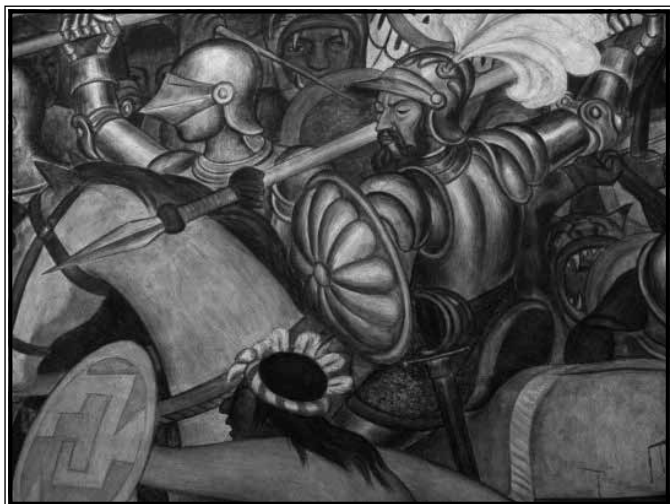
Cortés u borbi - oklop i konji bili su velika prednost Španjolaca

Montezuma je do 1519. vodio nekoliko vojnih pohoda, više „cvjetnih ratova” s više ili manje uspjeha, te je bio aktivan u provođenju dvorskih malverzacija kako bi ostvario svoje ciljeve. Sve u svemu, dolazak Španjolaca dočekao je kao stabilni vrhovni vladar najvećeg carstva u dotadašnjoj povijesti Srednje Amerike, koje je brojalo