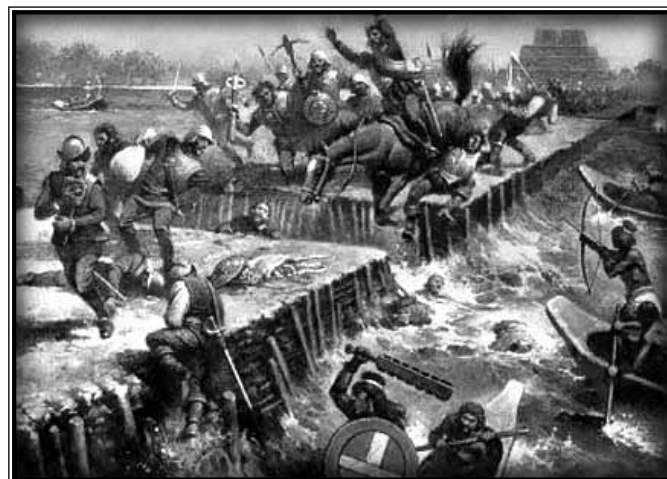
„Noć Suza“ - proboj Španjolaca iz Tenochtitlána

spasitelj i simbol otpora te je odmah okrunjen za novog cara uz obećanja da će se konačno i trajno riješiti strane pošasti (McLynn, 2009.).