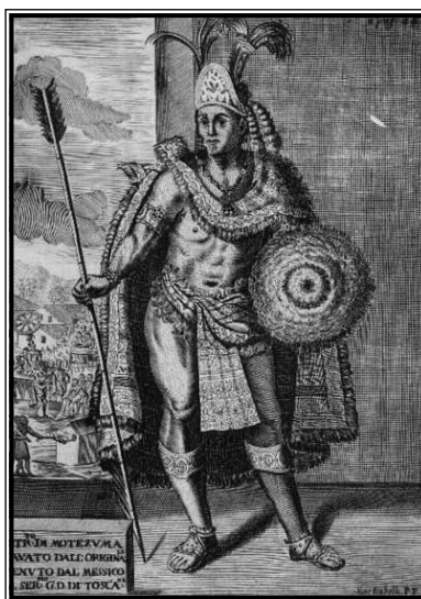
Montezuma II. (1466. - 1520.)

U heterogenom carstvu na koje su naišle pridošlice najvažniju poveznicu i ulogu imala je sama ličnost vladara. Tko je bila ta osoba koja ih je dočekala? Kralj Motecuhzoma Xocoyotl 4 ili Montezuma II. rođen je 1466. kao pripadnik kraljevske dinastije. Bio je osmi sin sedmog tlatonai a Tenochtitlána Axayacatla i prapraunuk