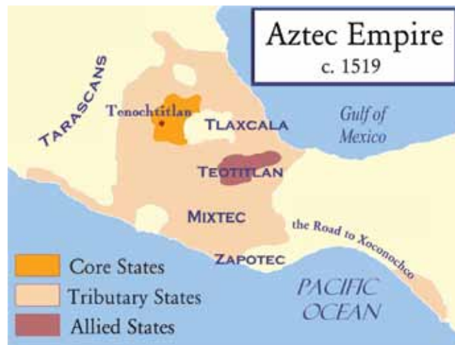
Aztečko carstvo 1519. godine