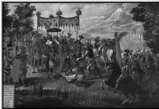
Susret Cortésa i Montezume

bez strjeljiva. 7 Cortés je tek sada uvidio pravu snagu domorodaca, koji su poslali pravu vojsku ratnika na njega, umjesto običnih seljaka i radnika koji su se borili u redovima Maya. U bezizlaznoj situaciji, gdje su Tlaxcalani imali apsolutnu stratešku prednost u mogućnosti opskrbe, brojčane dominacije i katastrofalnog stanja u kojem su se nalazili Španjolci, Cortés je pokazao svoju odlučnost u odbijanju mogućnosti povlačenja. Ono bi, doduše, vjerojatno za njega bilo i pogubno jer bi izgubio vjerodostojnost u očima svojih vojnika, kao i saveznika među lokalnim plemenima. U ovakvom odlučujućem trenutku, sreća se osmjehnula Cortésu jer su Tlaxcalani uvidjeli potencijalno izuzetno vrijednog saveznika u njemu. Za bolje razumijevanje ovoga, valja shvatiti u kakvoj su se poziciji Tlaxcalani nalazili. To su bila 3 grada-države u potpunosti okruženi Aztečkim Carstvom. Neizbježno, u