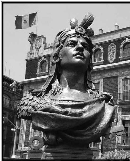
Bista Cuauhtémoca (1495. - 1525.) - posljednjeg vladara samostalnih Azteka

na jedan bili daleko slabiji od Azteka. Također, tijekom godina ratovanja hrpa španjolskog oružja došla je u ruke Azteka, tako da su sada i mnogi njihovi ratnici imali kastiljske mačeve i čelične oštrice na vrhu koplja. Uz to, topovi nisu mnogo koristili u uličnim borbama, dok su kuće i barikade bile kao stvorene za gerilsko ratovanje u kojem su Azteci bili majstori. Kiša kamenja, kopalja i strijela slijevala se niz svaku ulicu kojom bi pokušali napredovati Cortésovi ljudi. Zbog cjelokupne situacije, uspostava trajne baze unutar grada bila je izrazito rizična, a jedino drugo rješenje za trajnije zauzimanje grada bilo je potpuno uništenje. Svaka osvojena kuća ili hram bili su uništavani do temelja, kako ne bi preko noći ponovno pali u aztečke ruke. Borba za svaku uličicu trajala je do 30. lipnja, kada je Cortés naredio veći napad, koji je na njegovu nesreću završio općom katastrofom i zarobljavanjem te žrtvovanjem više Španjolaca. Ovakav moralni udarac počeo je urušavati koaliciju, što je prijetilo potpunom porazom. Umjesto da Cuauhtemoc iskoristi trenutnu moralnu prednost i vrati pod svoje okrilje ostale autohtone narode, koji su se priklonili pridošlicama, ali su ih