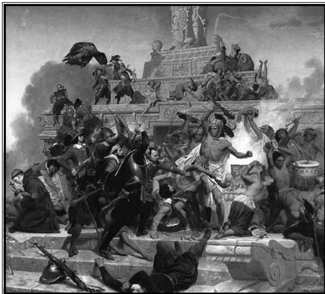
Masakr na hramu Teocalli u Cholulai

je pronašao i otkupio svećenika Jeronima Aguilara koji je bio zarobljen tijekom prošlih ekspedicije te držan kao rob. On je u svome zarobljeništvu naučio puno o kulturi Maya kao i njihov jezik. Upravo će on poslužiti Cortésu kao prevodilac i jedna od ključnih figura njegove diplomacije. Od njega je saznao i više o samim poganskim obredima i žrtvovanjima (Diaz, 2009.), što će mu poslužiti kao temelj za kreiranje ideološko-religijskog „drugog” u obliku mističnih, poganih i zlih domorodaca koji su koristili crne magije i ljudske žrtve. Mnoge svoje buduće zločine pravdat će upravo svojim osobnim križarskim ratom, borbom protiv istinskog zla i nastojanjem u pokrštanju domorodačkih plemena. Ne možemo točno utvrditi koliko je uistinu prava vjera igrala ulogu u ovakvome ponašanju, a koliko čisto političko opravdanje. Cortés je vjerojatno bio istinski vjernik, ali uz to i pravi pragmatik koji nije dopuštao da mu njegova vjera ometa političke i ekonomske planove na putu prema bo-gaćenju.