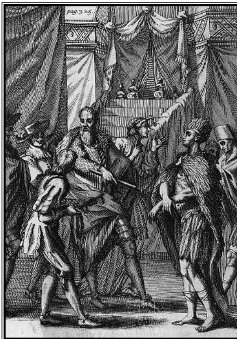
Cortés zarobljava Montezumu

Nakon dva tjedna u Choluli Cortés zajedno sa svojim Tlaxclan saveznicima kreće prema Tenochtitlánu. Montezuma je pokušao izaći s više izgovora i smicalica kako bi onemogućio njihov dolazak, ali oni su bili neumoljivi. Samo stanje na Montezuminom dvoru bilo je alarmantno, brojne frakcije su se stvarale oko toga što vladar treba napraviti. Naposljetku, odlučio je da će ih primiti kao goste, a ne pobiti kako su mu mnogi savjetnici govorili (McLynn, 2009.). Napokon, 8. studenog ekspedicija stiže do samog grada Tenochtitlana. Ono što su vidjeli, Cortés i Diaz opisuju s najvećim divljenjem. Sam susret s Montezumom protekao je u prijateljskim odnosima, uz mali incident kada je Cortés pokušao zagrliti cara. Nakon što su izmijenili darove, Španjolci su provedeni kroz grad. Pridošlicama je prizor bio kao u bajkama i fantastičnim pričama o egzotičnim civilizacijama. Opisujući veličanstvene prizore, najviše su ih se dojmili hramovi s poganskim idolima i velika tržnica u Tlatelocou, kao izvori poganstva i bogatstva. Tržnica u Tlatelocou, po Cortésovim riječima, bila je dvostruko veća od one u Salamanci i primala je gotovo 60 000 ljudi svaki dan. Diaz nadodaje, nakon što su vidjeli grad s vrha središnjeg hrama-piramide, da