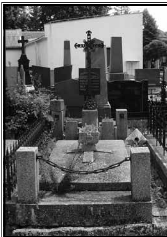
Grobnica obitelji Adamovich de Csepin na Aninom groblju u Osijeku