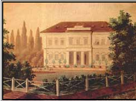
Dvorac Adamovich – Mihalović – Knobloch