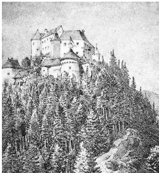
Dvorac Velenje krajem 19. stoljeća (Privatna zbirka baruna Adamovića de Csepin, Zagreb)