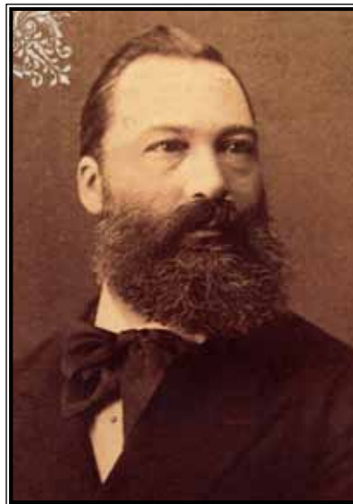
Ivan Kapistran II. pl. Adamovich de Csepin (Kalendar Hrvatske narodne banke, 2012, ožujak)

udruge u Osijeku. (Šćitaroci, 1998: 367) U Čepinu je 1836. godine pokrenuo prvu šećeranu na parni pogon u Hrvatskoj, tvornica je radila do 1853. godine. Uz Adamovicha se kao vlasnik navodi i bečka tvrtka „Mayer & Söhne“. Tada je to bila jedna od najvećih prehrambenih tvornica u Slavoniji, zapošljavala je stotinjak radnika. (Šćitaroci, 1998: 108) Dok Sršan navodi da su osim Adamovicha suvlasnici šećerane bili N. Meyer i I. G. Landauer. Tvornica je radila s najmodernijim francuskim strojevima od 1836. do 1853. godine . U Čepinu je također osnovao tvornice za preradu ulja, svile i kudjelje, užariju i mlinove. Također je podigao ekonomske jedinice tzv. pustare. Uveo je napredno stočarstvo, nove poljoprivredne kulture i agrotehničke mjere te mehanizaciju u obradi zemlje.