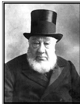
Paul Kruger - vođa Bura u burskim ratovima

Napetost se povećala kada je u prosincu 1898. ubijen britanski državljani Tom Edgar od strane transvaalskog činovnika. Na noge su se digli strani radnici kao i sam Milner koji je oprezno pripremao teren za budući rat, kako u Britaniji, tako i u Južnoj Africi. Milner je otišao tako daleko da je u ožujku 1899. kraljici Viktoriji predao peticiju koju je potpisalo 22 000 uitlandera , u kojoj oni traže pomoć i intervenciju. Pretoria, glavni grad Transvaala, dobio je ultimatum: ili će doći do zakonskih reformi ili će izbiti rat. (Fremont-Barnes, 2003: 31)