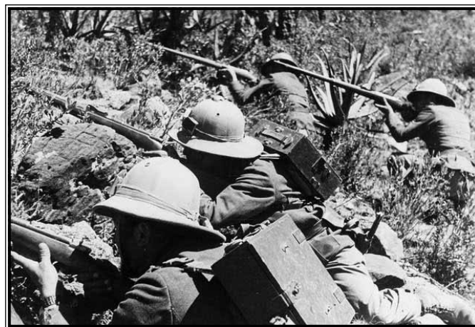
Talijanski vojnici tijekom sukoba

U takvoj situaciji započinje najkontroverzniji vid Etiopskoga rata – uporaba kemijskog oružja od strane fašističkoga zrakoplovstva. Dana 22. prosinca izvršen je prvi od serije zračnih napada bombama C.500.T, od kojih je svaka napunjena sa 212 kilograma iperita. Prvi ciljevi bile su napadne kolone Etiopljana koje su vršile sve veći pritisak na talijanske položaje, a kasnije se napadi šire i sve više u unutrašnjost Etiopije, s ciljem zastrašivanja stanovništva. Treba napomenuti da su zapovijedi o korištenju kemijskog oružja dolazili direktno iz Rima – od