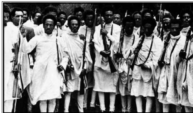
Etiopski feudalni vojnici

Smatra se da je u sedam mjeseci invazije poginulo oko 4350 Talijana uz još oko 4500 askarija iz Eritreje, Somalije i Libije (Del Boca, 2010: 243, bilj. 1). Broj poginulih Etiopljana veoma je teško procijeniti, ali pretpostavlja se da iznosi više od 300,000 mrtvih (Del Boca, 2010: 252). Italija je objavila da je do prosinca 1936. Etiopija u potpunosti pacificirana i pod potpunom kontrolom kolonijalnih vlasti (Mack Smith, 1980: 83). Međutim, situacija na terenu je bila nešto složenija. Talijani su u većini slučajeva boravili samo u svojim utvrđenim logorima i unutar većih gradova, što je dovelo do stvaranja otpora u ruralnim krajevima. Logična posljedica vojne okupacije i uprave bilo je korištenje nehumanih metoda od strane talijanske vojske i fašističke milicije prilikom obuzdavanja, ali i navodne prevencije raznih oblika otpora lokalnog stanovništva. Brutalna kažnjavanja i smaknuća