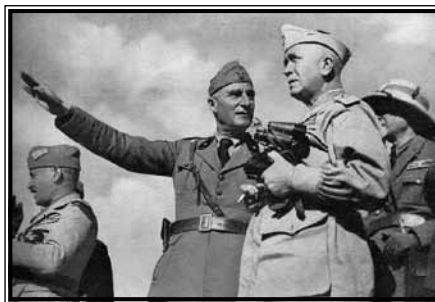
Glavni talijanski zapovjednik Pietro Badoglio u Etiopiji (desno, s dalekozorom)

sfere pojedinih europskih zemalja. Također, ne smijemo zaboraviti da su sve europske kolonijalne sile uglavnom putem vojne agresije došle do svojih afričkih posjeda. Mussolinijeva se diplomatska inicijativa poklopila s tajnim pripremama za invaziju koji su trajali kroz cijelu 1935. godinu (Farrell, 2008: 291). On je bio siguran da Liga naroda, kojom su dominirale Velika Britanija i Francuska, neće djelovati u slučaju talijanskog napada na Etiopiju, kao što uostalom to nije učinila u slučaju neobjavljenog rata kojeg je 1931. pokrenuo Japan protiv Kine (Farrell, 2008: 291).