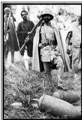
Etiopski car Haile Selassie I. pozira s neeksploziranim talijanskim bombama

Pred etiopski rat, među dvije vojske postojao je veliki disparitet. Talijani i njihovi kolonijalni vojnici askariji (unovačeni domaći stanovnici Libije i Istočne Afrike) imali su na raspolaganju, osim pušaka, i mitraljeze i topništvo. Pomoć u napredovanju mogli su im pružiti motorizirane (celere) divizije sa svojim kamionima i oklopnim automobilima Lancia 17 tip 2, te oklopne divizije sa tanketama Fiat-Ansaldo. Dakako, tu je bilo i Kraljevsko ratno zrakoplovstvo Italije ( Regia aeronautica ) sa lovcima tipa Ro.1 i bombarderima tipa Caproni Ca.101, sposobnima nositi teret bombi od ukupno 500 kg. Mračnu stranu talijanskog arsenala činilo je oružje za masovno uništenje, koje je Ženevska konvencija iz 1925., potpisana i od Italije 1928. godine, zabranila kao oružje prvog udara. Italija je u svoje kolonije pred Etiopski rat poslala velike količine kemijskih sredstava: agresivno-zagušljivi plin fozgen, suzavac, i plikavce (iperit, arsin, levisit) (Del Boca, 2010: 93).