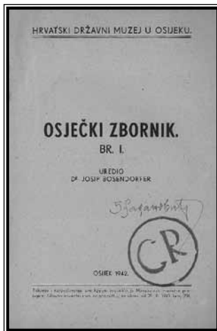
Osječki zbornik br. 1.