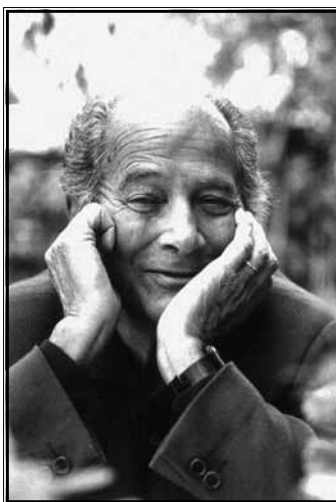
Redatelj Gillo Pontecorvo (1919. - 2006.)

čelije pobunjenika te urbano ratovanje. Kako se alžirski rat za nezavisnost danas vodi kao jedan od najvažnijih dekolonizacijskih ratova i procesa, moglo bi se protumačiti kako je film osuda francuskoga kolonijalizma, preciznije, posljedica do kojih je takav kolonijalizam doveo. No, kolonijalizam nije jednoznačan fenomen i ne odražava se svagdje jednako niti s jednakim posljedicama. U ovome je slučaju, krajnja posljedica težnja narodnome suverenitetu kroz dugotrajan i mukotrpan ratni sukob koji odnosi mnogo civilnih žrtava. Upravo to prikazuje i zadnja scena filma; alžirski narod kliče na ulicama demonstrirajući suverenost, čak i nakon poraza u oružanim sukobima, što je bilo dovoljno da uvjeri francusko civilno stanovništvo,