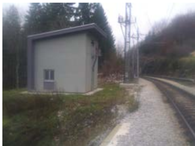
Slika 5. Postrojenje za sekcioniranje s neutralnim vodom (PSN1) Lokve

Približno u sredini kraka napajanja, tj. između elektrovučnog postrojenja i postrojenja za sekcioniranje s neutralnim vodom (PSN) izvedena su postrojenja za sekcioniranje (PS). Njihova svrha jest dijeljenje željezničke mreže u sekcije koje su napajane radijalno, svaka iz svoje elektrovučne podstanice, a primarno