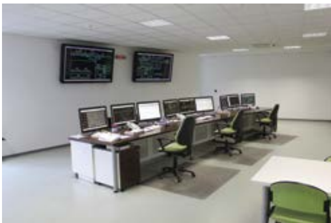
Slika 3. Dispečerska prostorija CDU-a Zagreb nakon rekonstrukcije 2012.

Napokon, nakon više od 40 godina upravljanja stabilnim postrojenjima za napajanje električne vuče s tri nepovezana, odvojena i tehnološki različita sustava, godine 2011. došao je napokon i red na rekonstrukciju i modernizaciju CDU-a Zagreb (slika 3.). Ugrađena je najnovija inačica programskog sustava SCADA Proza NET tvrtke Končar, čiju hardversku osnovu čine serveri i stanična računala te različiti periferni mrežni uređaji. Modernizirana su komunikacijska sučelja, unaprijeđena je mreža, ugrađeni su pretvarači protokola te su izvedene sve prilagodbe kako bi sustav mogao preuzeti nadzor i upravljanje nad svim postrojenjima, posebno nad onima tehnološki zastarjelima koja tek čekaju rekonstrukciju i modernizaciju. Navedeni pretvarači protokola (EFD 300K) te novougrađeni komunikacijski podsustav u centru i u moderniziranim postrojenjima provode konverziju svih postojećih protokola starijih daljinskih stanica u protokol IEC 60870-5-104. Navedeni protokol omogućava komunikaciju CDU-a s podstanicom kao i komunikaciju različitih uređaja i sustava SCADA unutra samog CDU-a, koristeći standardnu TCP/IP mrežu. Do sada su s CDU-om Zagreb, a preko magistralnog svjetlovoda, povezana postrojenja EVP Resnik, EVP Novska i EVP Zaprešić.