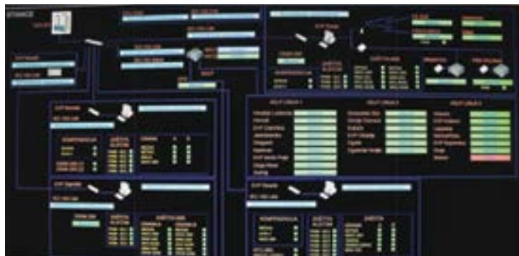
Slika 7. Prikaz stanja komunikacije postrojenja s CDU-om Zagreb

Za potrebe daljinskog upravljanja postrojenjem potrebno je prenijeti određeni broj naredbi upravljanja, signala stanja, alarma i mjerenja u nadređeni centar daljinskog upravljanja.