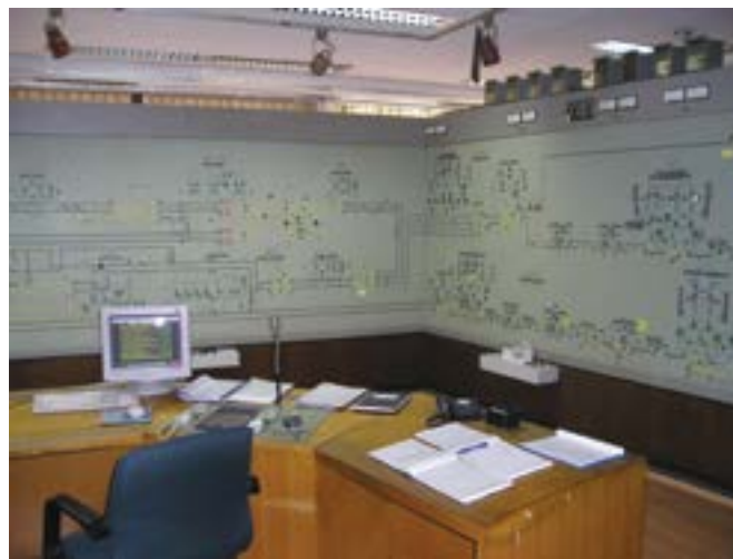
Slika 2. CDU Zagreb prije cjelovite modernizacije

Prvo povezivanje podstanice s centrom svjetlovodom, i to cijelim prijenosnim putem, izvedeno je 2008. kada su povezani EVP Zaprešić i CDU Zagreb. S ugradnjom magistralnog svjetlovodnoga kabla 2011./2012. nastavljena je njegova primjena kao medija za prijenos u sustavu daljinskog upravljanja elektroenergetskim postrojenjima i kolodvorskim uređajima.