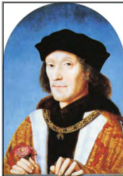
Henry VII (1485. - 1509.)