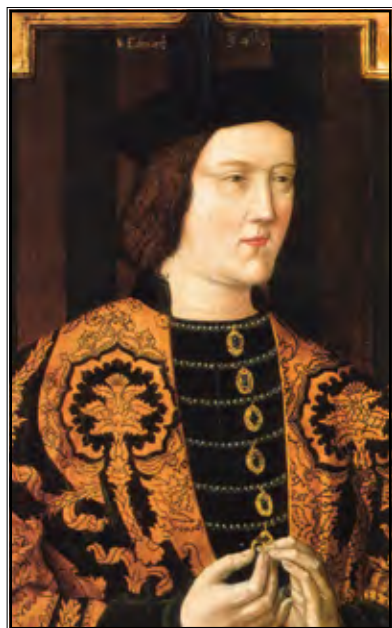
Edward IV (1442. - 1483.)