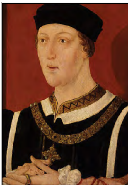
Henry VI (1422. - 1461.)