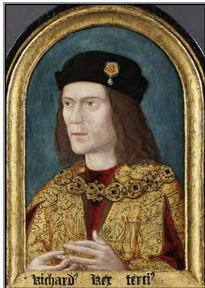
Richard III (1483. - 1485.)