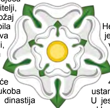
Bijela ruža Yorka