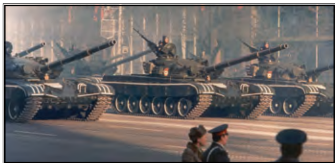
Proslava Oktobarske revolucije 1983. godine u Moskvi.

Zapadnjačka historiografija bila je ponajviše pod utjecajem Hladnog rata jer je bilo potrebno obezvrijediti socijalistički sustav i čvrste dogme o prirodnosti boljševičke vladavine. Temelji boljševičkog osvajanja vlasti su slaba vladavina Nikole II., loša gospodarska situacija u zemlji koja je samo pogoršana Prvim svjetskim ratom, boljševička manipulacija masama s okrutnom vladajućom strukturom koja joj je omogućavala preživljavanje i vladavinu. Oktobarsku revoluciju vide kao nasilni udar organiziran od strane protototalitarnih boljševika, što se nastavlja Staljinovom vladavinom kao prirodnim razvojem ideologija Marxa i Lenjina.