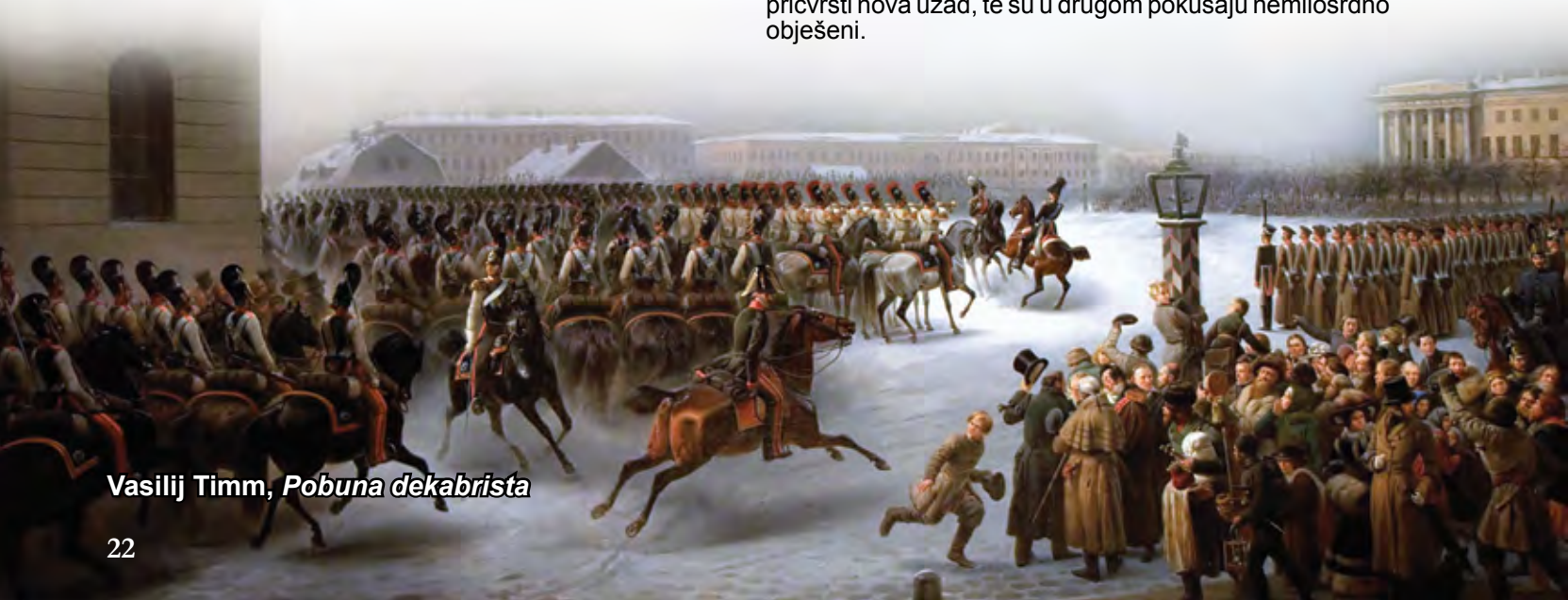
Vasiliy Timm, Pobuna dekabrista