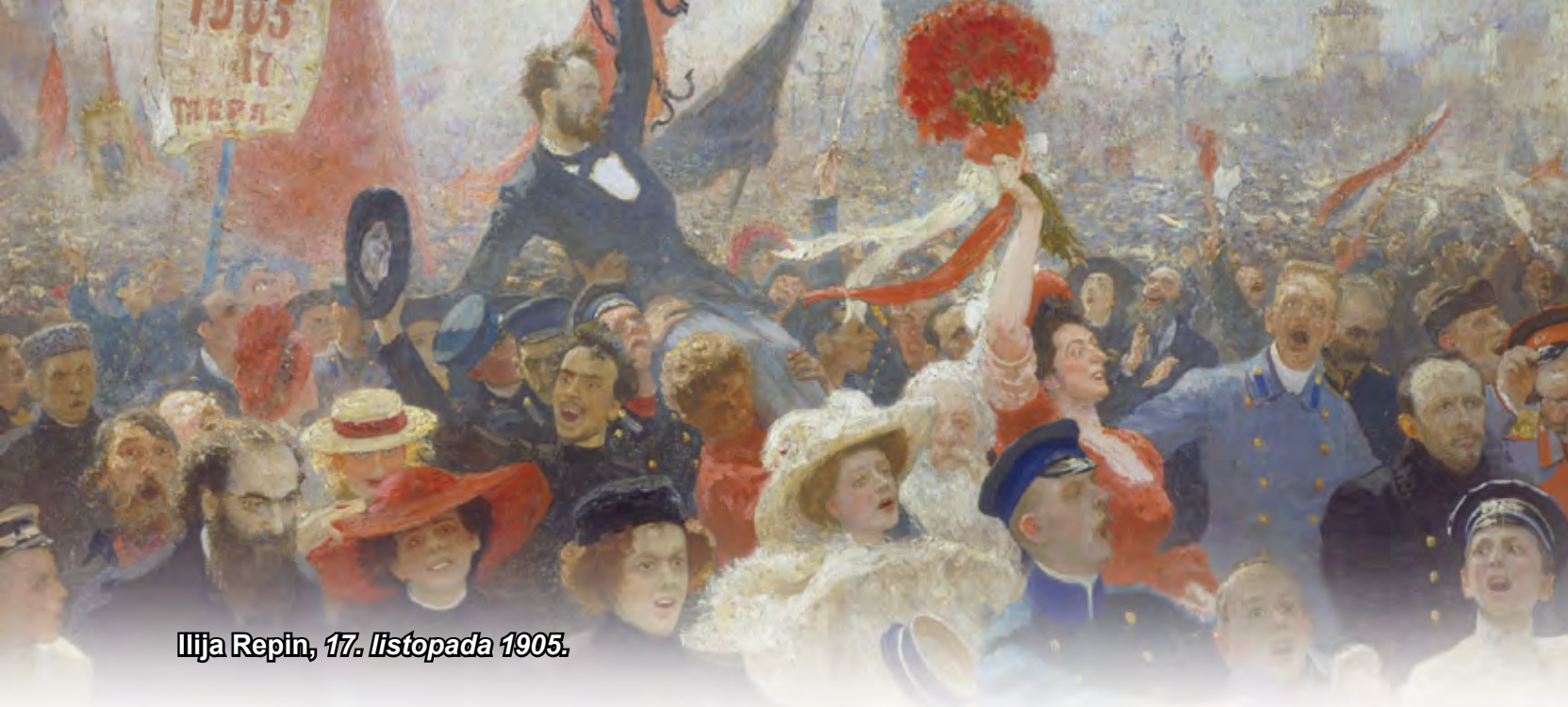
Ilija Repin, 17. listopada 1905.