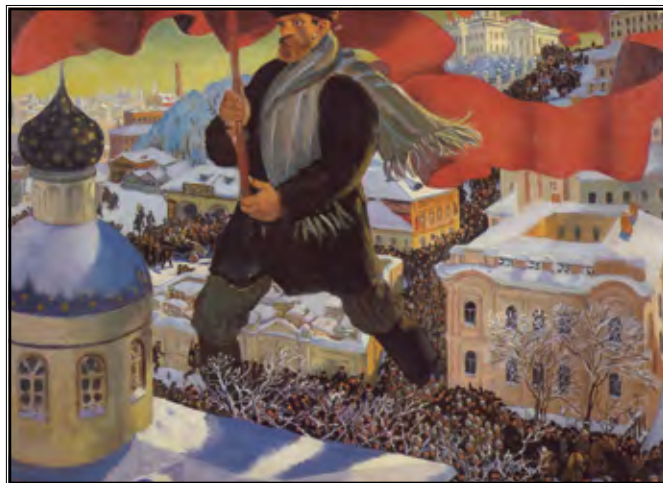
Boris Kustodijev, Boljševik

U Petrogradu, tada glavnom gradu Rusije, 25. veljače 1917. (prema gregorijanskom kalendaru 10. ožujka) izbija masovni štrajk koji je već dva dana prije počeo mobilizirati nezadovoljne mase. Revolucionari su uspjeli izazvati ostavku vlade te osloboditi političke zatvorenike, a sljedeći cilj bio je svrgavanje cara. Formirana je nova vlast čime je službeno nastalo dvovlašće, no u borbi za vlast nije imala jednakih partnera. Izvršni komitet Dume činila je liberalna buržoazija (menjševici), a Sovjet radnika i vojnika socijalisti (boljševici). Budući da su te dvije skupine drugačije vidjele svrhu revolucije, sukobi su se nastavljali, jer je prema menjševicima revolucija treba biti građanska, a prema boljševicima narodna. Uloga Nikole II. također je bila razlog prijevora jer Sovjet traži trenutnu abdikaciju cara, a odbor Dume traži nametanje caru nove vlade po vlastitom izboru, ali ne i abdikaciju. Vidjevši da boljševici imaju veću stvarnu moć u zemlji, Nikola II. silazi s prijestolja, ostavljajući vlast svome bratu, knezu Mihajlu, koji, uvidjevši da nema potporu ključnih čimbenika u zemlji, potpisuje abdikaciju. (Živanov, 1975: 86) Rusija tada, 17. ožujka, po prvi puta u povijesti postaje republika.