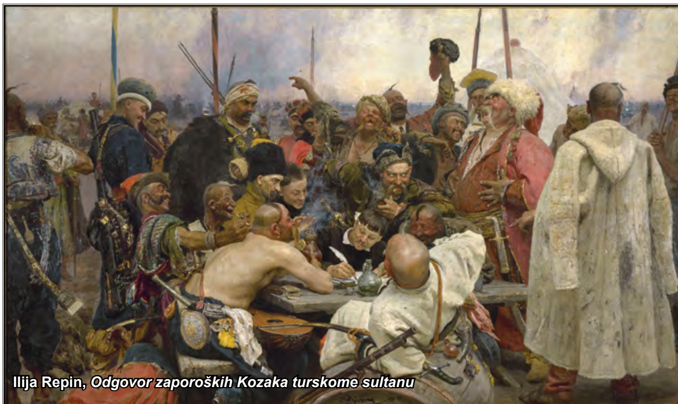
Ilija Repin, Odgovor zaporoških Kozaka turskome sultanu

Kozake je predvodio karizmatični Kondrati Bulavin po kome je cijela pobuna dobila ime, a njegov prvi potez bio je ubojstvo Yurija Dolgorukog.