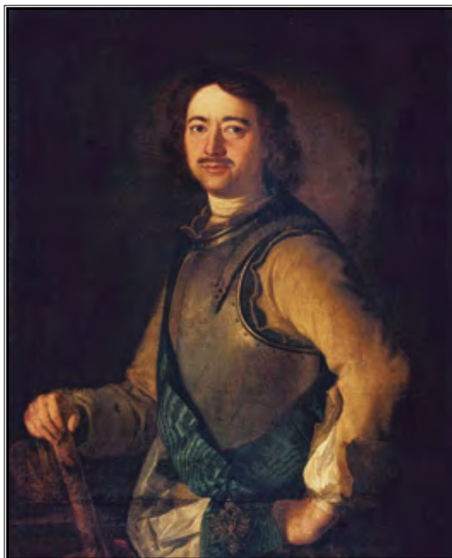
Petar Veliki (1682. - 1725.)

Konzervativno društvo, kakvo je bilo rusko na početku 18. stoljeća, nije s odobravanjem dočekalo reforme. Neke od tih društvenih promjena, koje je Petar želio uvesti, ticale su se vjere i narodnih običaja, duboko ukorijenjenih u tradiciji. Njegovo divljenje zapadnoeuropskim civilizacijskim dostignućima došlo je do punog izražaja prilikom putovanja Europom, gdje je posjetio Amsterdam, London i Beč. (Berdjajev, 2006: 21) Budući da je želio unaprijediti svoju vojsku, dosta je pažnje posvetio izradi oružja i vojnim taktikama u zemljama koje bi posjetio. Putovao je pod lažnim imenom, a svoju je titulu otkrivao samo vladarima koji bi mu dopustili slobodno istraživanje brodogradilišta i radionica vojne opreme. Koliko je bio opčinjen mehanikom i procesom izrade govori i činjenica da je kao običan tesar odlazio raditi u ta brodogradilišta samo da bi naučio što više. Njegova velika želja bila je stvoriti moćnu mornaricu kojom bi zavladao sjeverom Europe, a na jugu prekinuo dominaciju Turaka. Društvene reforme, kojima je pokušao modernizirati rusko društvo, izazvale su bijes i zgražanje u pučanstvu, a kako su bile