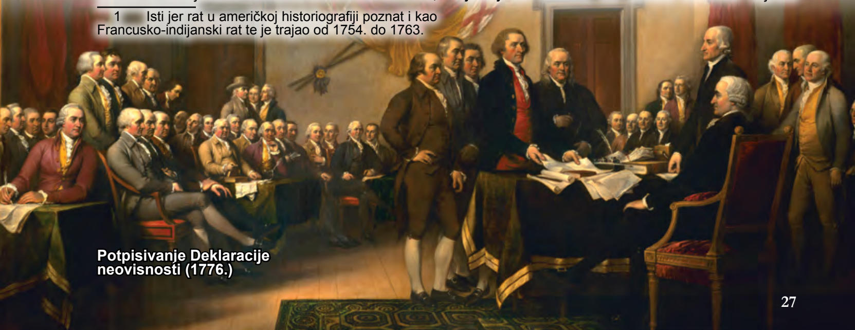
Potpisivanje Deklaracije neovisnosti (1776.)

Do početka 20. stoljeća i prvih značajnijih kritika revolucije, Washington i ostali predvodnici američkog rata za neovisnost predstavljali su ideale i gotovo mitološke figure za povjesničare koje nije pretjerano zanimala prošlost izvan granica SAD-a. Nakon Građanskog rata (1861. – 1865.) javila se potreba za stvaranjem povijesti koja će propagirati nacionalno jedinstvo u vrijeme animoziteta Sjevera i Juga. Jedan od značajnijih američkih historioografa tog vremena bio je i George Bancroft (1800. – 1891.) koji je u deset svezaka svoje Historije Sjedinjenih Država od otkrića Amerike slijedio