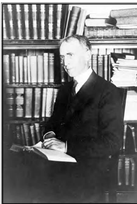
Charles A. Beard

Suvremena ili postmodernistička historiografija naglasak stavlja na socijalnu povijest i društvenu ulogu do sada uglavnom zanemarenih grupacija poput žena, robova, urođenika i radnika, pritom dekonstruirajući ranije prihvaćene "velike priče", čime je shvaćanje i istraživanje Američke revolucije ponovno izmijenjeno u odnosu na prethodna desetljeća i pripadajuće popularne paradigme.