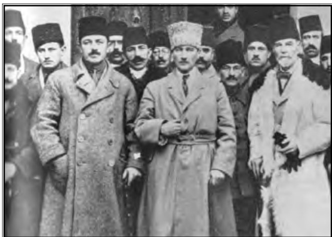
Mustafa Kemal i Mladoturci

Mladoturški pokret, pod čijim su se imenom okupile različite opozicijske grupe, nastojao je očuvati Osmansko Carstvo vidjevši njegov spas u uvođenju parlamentarizma, proglašenju Ustava koji će jamčiti slobode i prava svih stanovništva bez obzira na vjeru. To su bili osnovni ciljevi Mladoturske revolucije, koji su općenito gledano, ostvareni u