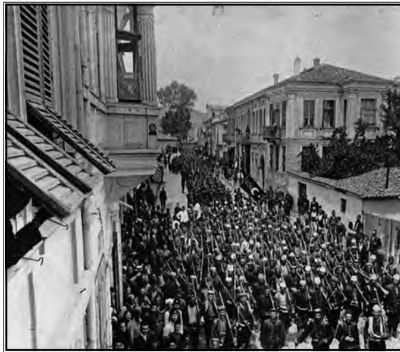
Mladoturska revolucija u Manastiru, 23. srpnja 1908.

koja je pokrivala sve europske provincije Carstva i koja je učinkovito i lako provodila propagandnu kampanju, nezadovoljstva među vojskom i ostalim stanovništvom išla su im u korist, kao i makedonsko pitanje koje je stvorilo pravi strah od strane intervencije i raspadanja Carstva. Ne zna se jesu li vođe ITC-a odredile točan datum početka revolucije, no okolnosti su ih prisilile da reagiraju u srpnju 1908. U lipnju 1908. počele su se širiti glasine o dogovoru između Edvarda VII. i Nikole II. o podjeli Makedonije što je utjecalo na ITC da pokrene program mobilizacije, a drugi razlog za početak djelovanja bila je planirana akcija sultanovih sigurnosnih snaga koje su namjeravale uništiti ITC i ugušiti pobunu u nastanku. Naime, brza ekspanzija ITC-a u svim europskim dijelovima Carstva onemogućila je Mladoturcima da djeluju isključivo tajno, čak i Makedoniji gdje je mreža sultanovih špijuna bila manje učinkovita. Organizacija koja je brojala nekoliko tisuća članova teško je mogla djelovati u tajnosti, te je došlo do istraga lokalnih vlasti. U lipnju 1908. situacija je postala kritična, te je sultan, s namjerom da slomi pokret, pozvao neke od vojnih vođa ITC-a u Carigrad, a u Makedoniju su poslani timovi istražitelja. Enver Bej i major Ahmed Nijazi bili su među časnicima koji su pozvani u Carigrad, no kako