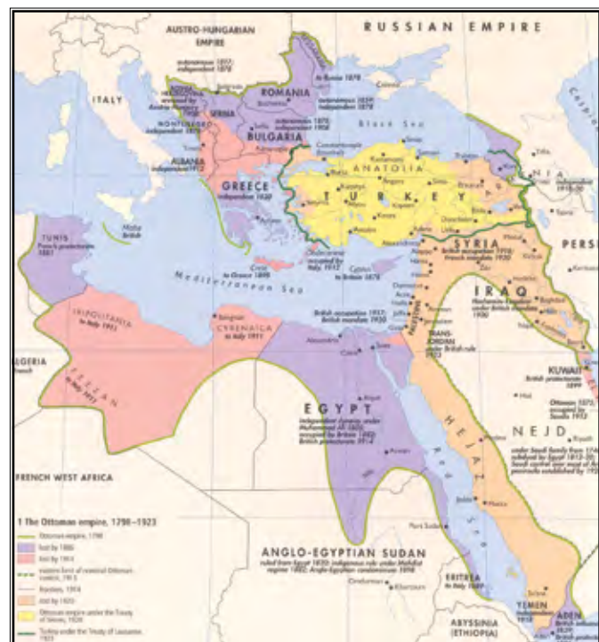
Karta Osmanskog Carstva kroz povijest

Po povratku u zemlju nastavljaju sa svojom djelatnošću te su iskoristili lošu situaciju u Carstvu (bosanski ustanak 1875. godine, ustanak u Bugarskoj i ustanak studenata teologije) i svrgnuli sultana Abdul Aziza. No kako se novi sultan Murat V. nije pokazao kao sposoban vladar, ubrzo su i njega svrgnuli te za sultana postavili njegovog mlađeg brata Abdul Hamida koje je obećao proglasiti Ustav. Osim što je bio pod pritiskom grupe reformatora, među kojima je najznačajniji veliki vezir Midhat-paša, a koji su ga postavili za sultana, i međunarodne prilike prisilile su novog sultana da poklekne i proglasi Ustav. Naime, u srpnju 1876. god. Srbija i Crna Gora proglasile su rat Porti, a europske su sile bile zabrinute položajem kršćanskog stanovništva u Carstvu te su vršile pritisak da se provedu prokršćanske reforme. (Hanioglu, 2008: 111-112) Iako se sultanu nisu sviđale ideje Midhat-paše da