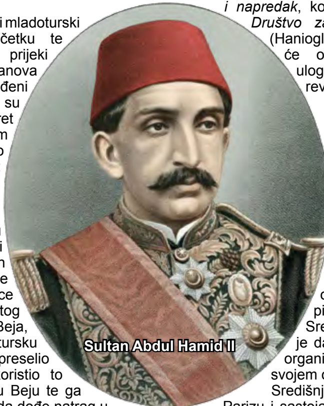
Sultan Abdul Hamid II

upravo suprotan, kongres je završio šizmom. Glavno pitanje oko kojeg su se sudionici podijelili bilo je uključivanje europskih sila i traženje njihove intervencije. Stvorile su se dvije glavne frakcije: ona koja je bila za stranu intervenciju i ona oko Ahmeda Rize koja se tome protivila. Članovi prve frakcije željeli su uspostaviti vezu s Velikom Britanijom i tražiti njezinu pomoć za provođenje državnog udara, no u tome nisu uspjeli. Uz tu je frakciju pristao i Sabaheddin te je 1905. reorganizirao tu grupu pod imenom Liga za privatnu inicijativu i decentralizaciju . Kako samo ime govori, Sabaheddinova se Liga zalagala za decentralizaciju Carstva, koju su ostali vidjeli kao opasnost. Dio koji se protivio stranoj intervenciji, smatrajući reorganizaciju Carstva i svrgavanje sultana unutrašnjim pitanjem, bilo je već spomenuto Osmansko društvo za ujedinjenje i napredak , koje će biti preimenovano u Društvo za napredak i ujedinjenje . (Hanioglu, 2008: 146-147) Upravo će ono odigrati najznačajniju ulogu u provođenju Mladoturske revolucije 1908. godine.