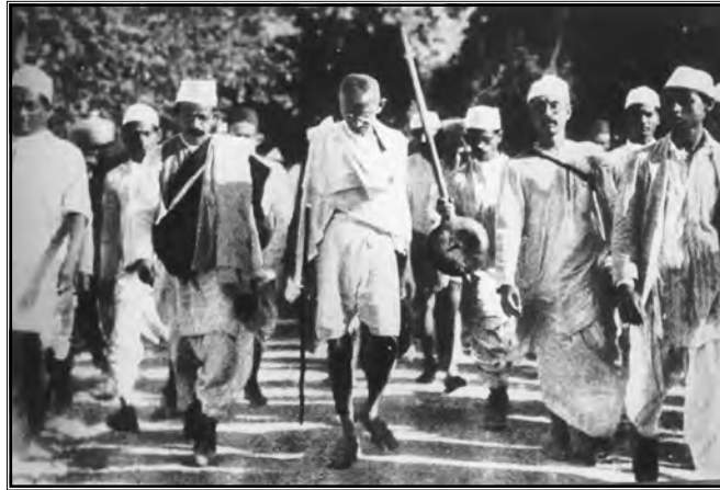
Gandhi sa suradnicima maršira prema oceanu kako bi sakupili sol

duž obala oceana sakupljati sol. Kongresni aktivisti sakupljenu su sol prodavali diljem Indije tako stvarajući fondove za daljnje financiranje Pokreta građanskog neposluha. Uslijedile su demonstracije, a prosvjednici iz grada Pešavara uspjeli su istisnuti britanske trupe i proglasiti prvu Gandhijevsku gradsku republiku. Tada je pri britanskoj intervenciji poginulo sedamdesetak Indijaca, a pri još jednoj takvoj intervenciji u Bangladešu ubijena su šestorica. Drugdje su demonstracije prošle bez prolijevanja krvi, no Britanci su ipak punili zatvore Gandhijevim sljedbenicima, a naposljetku je i on sam uhićen (Simić, 1984: 152-155).