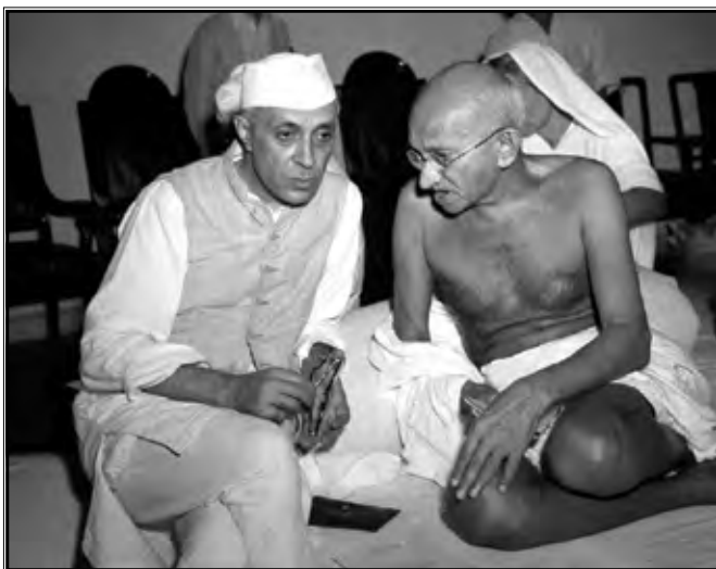
Gandhi s Nehruom, svojim nasljednikom i prvim indijskim premijerom

tada bio mrzak čak i njegovim najbližim suradnicima (Gandhi, 2009: 188). Ovim pitanjem počinje se aktivno baviti odmah nakon povratka iz Europe, kada su ga vlasti ponovno zatvorile. To je označilo još jednu prekretnicu u indijskoj povijesti. Naime, nakon što su stoljećima svi hinduisti bezuvjetno prihvaćali strogu kastinsku podjelu, pod Gandhijevim autoritetom Indiji polako počinju mijenjati gledišta na stoljetni sistem. Upravo to je bio najveći uspjeh još jednog njegovog posta, tijekom kojeg se Indija ujedinila: "nedodirljivi" su puštani u hramove, pili su iz istog bunara s ostalim hindusima, svi su se udružili protiv diskriminacije kako bi voljeni Gandhi ostao na životu (Fischer, 1984: 118-128). Iako se duša naroda ne mijenja s jednim događajem, mada snažnim poput "epskog posta", ipak je tih dana Indija pokazala svoju jedinstvenu dušu.