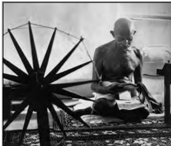
Izrada vlastite odjeće bila je sastavni dio Gandhijevog khadi pokreta

Pokret građanskog neposluha bio je plod Gandhijevih dugogodišnjih razmišljanja, upoznavanja, elaboracija i eksperimentiranja: "Građanski neposluh je riznica moći! Zamislite čitav narod koji se odbija pokoriti zakonima i spreman je snositi posljedice nepokoravanja! Oni će do zastoja dovesti čitavo zakonodavstvo i izvršno ustrojstvo. Policija i vojska mogu smiriti manje skupine ljudi ma koliko bile snažne. Ali nema te policije ni vojske pred kojom će pokleknuti odlučna volja naroda spremnog da pati do krajnjih granica." (Gandhi, 2003: 155) Od borbe građanskim neposluhom neodvojiva je Ahimsa ili Nenasilje: "Naravno da biste mogli reći da nema nenasilne pobune, toga nikada nije bilo u povijesti. Međutim, želja mi je da mogu navesti takav primjer, a san mi je da se moja zemlja oslobodi nenasiljem. Svijetu bih želio bezbroj puta ponoviti da neću nastojati pribaviti slobodu svojoj zemlji po cijenu nenasilja." (Gandhi, 2003: 103)