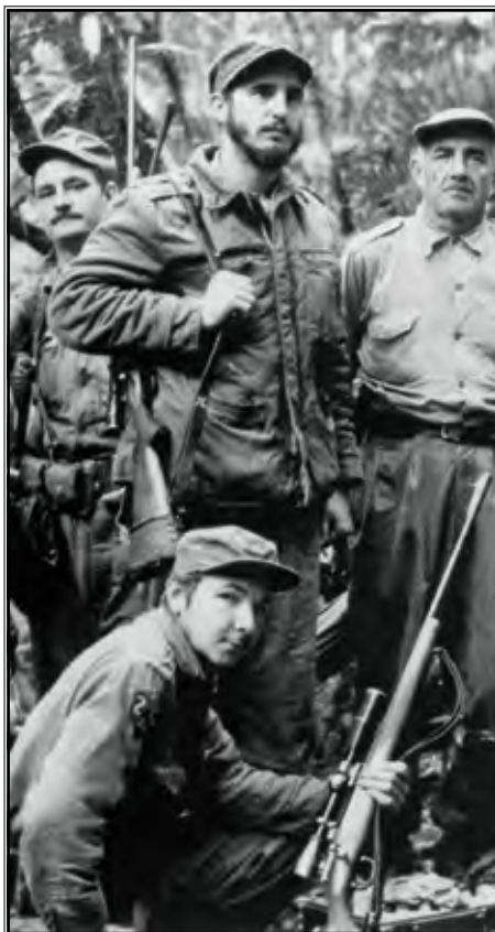
Castro i pobunjenici

U cilju sprječavanja potencijalnih nemira i nezadovoljstava, Amerikanci su 1902. proglasili neovisnu Republiku Kubu, čime su, barem formalno, prikrili svoju dominaciju. Tzv. Plattovim amandmanom osigurali su pravo intervencije u kubansku politiku kad god je potrebno da se osigura "vlada koja može štiti život, imovinu i slobodu pojedinca". U takvim okolnostima, vrlo brzo se javilo ogorčenje na američku dominaciju, osobito među mlađom populacijom, studentima željnima promjene svijeta oko sebe. Iznenada je američki