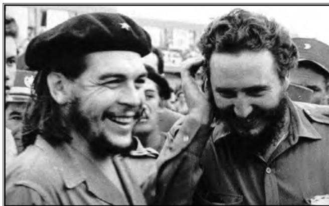
Che Guevara i Castro

Guevara danas predstavlja simbol otpora prema sveprisutnom i vladajućem kapitalizmu, a njegovo poznato bradato i vojničko lice, postalo je simbolom nade i borbe za bolji svijet. Ponekad se u tolikoj mjeri pretjeruje da ga se naziva Kristom komunizma uspoređujući ga s Isusom koji je također želio promijeniti svijet. (1)