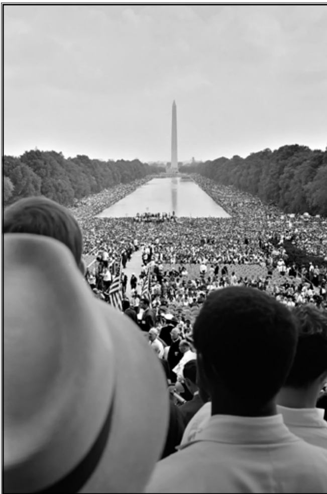
Washington 1963. godine

Snivam da će jednoga dana moje četvero dječice živjeti u zemlji u kojoj ih se neće vrednovati po boji njihove kože, već po osobinama njihove duše.