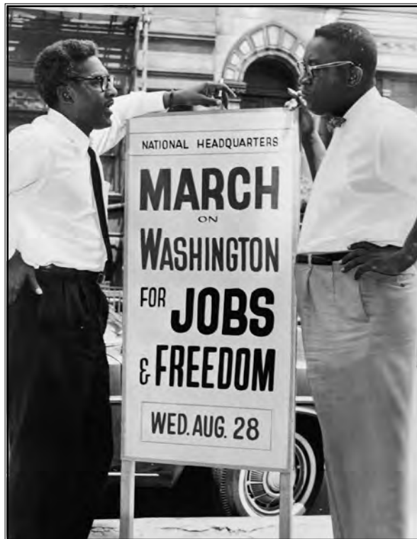
Poziv na pohod u Washington

Za sljedeću točku djelovanja King i SCLC odabrali su Selmu u Alabami, grad u kojem je Afroamerikancima i dalje onemogućeno glasanje na izborima koji bi bili demokratski. Iako su na papiru oni mogli glasati, trebali su se registrirati i tu su bili onemogućeni. Kampanja je započela u siječnju 1965. godine, a prve demonstracije su započele 7. ožujka, no bez uspjeha zbog gomile koja ih je napala i policijske brutalnosti. Taj dan bit će zabilježen kao "Krvava nedjelja". Iako su bili napadnuti, prosvjednici su se koristili Kingovom metodom nenasilja, bili su prisutni i novinari, te je ovaj događaj bio prekretnica u zadobivanju potpore javnosti u borbi za građanska prava. Nakon ovog pohoda, King je odmah organizirao drugi za 9. ožujka