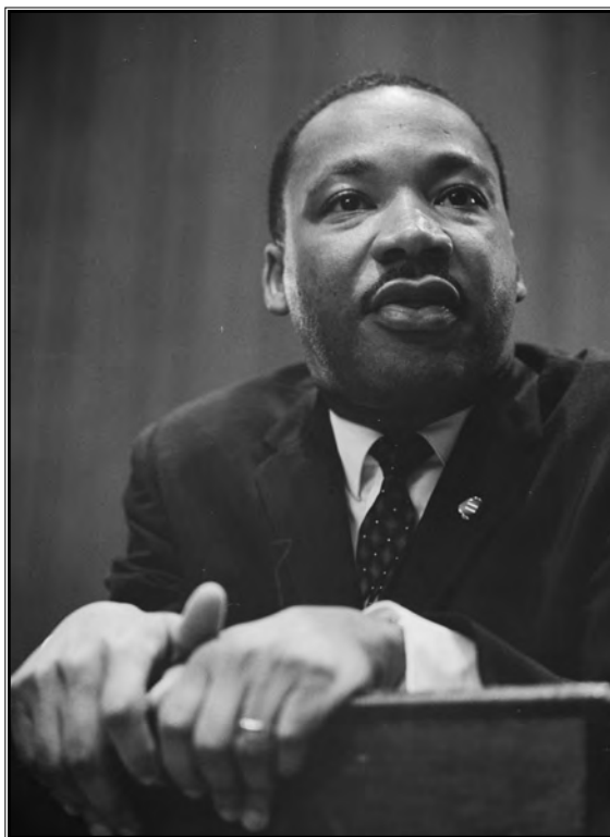
Martin Luther King (1929. – 1968.)

Godina 1955. označila je prekretnicu u demokratizaciji američkog društva. Jednim odlučnim "Ne" gospođe Rose Parks pokrenuo se slijed događaja o kakvom u to vrijeme mnogi nisu ni sanjali. No, Martin Luther King nije bio jedan od njih, on je svoj san o punoj slobodi Afroamerikanaca odlučio slijediti i ostvariti. Borba je započela jednostavnim bojkotom autobusa kojom su željeli prekinuti rasnu segregaciju. Svojim mirnim, nenasilnim prosvjedima, borci su za građanska prava izvolijevali pobjednu za pobjedom, preko Montgomerya, Albanyja, Birminghama i Selme sve do Washingtona. Unatoč nasilnim reakcijama na prosvjede, stalnim prijetnjama smrću, Martin Luther King nije odustajao od borbe sve do svoje preuranjene smrti.