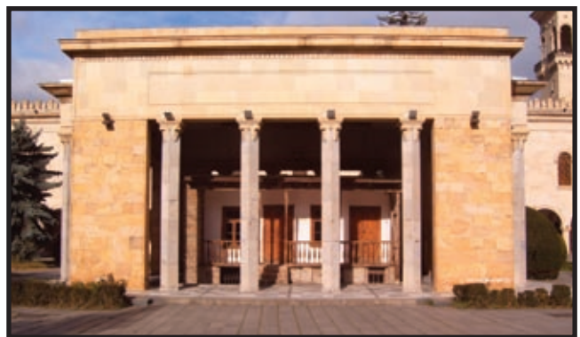
Staljinova rodna kuća u Goriju, Gruzija

Staljinov otac Visarion Ivanovič Džugašvili, oko 1875. godine napustio je selo Didi-Lilo, nedaleko od Tbilisija te se naselio u gruzijskom općinskom središtu Goriju. Tamo je otvorio malu postolarsku radionicu. On je bio sin gruzijskih seljaka, koji su samo deset godina prije njegovog rođenja još bili kmetovi. U Goriju se oženio djevojkom sličnog skromnog podrijetla, Ekaterinom Geladze, čiji je otac bio kmet Grigorij Geladze iz sela Gambareuelija. Ona je, vjerojatno, kao kći siromašnih seljaka došla u grad da bi se zaposlila kao sluškinja u nekoj armenskoj ili ruskoj obitelji srednjeg staleža. Kada se udala, Ekaterina je imala svega petnaest godina. Unajmili su bijednu kućicu na samom rubu Gorija i plaćali za nju rubalj i pol mjesečno. «Kućica