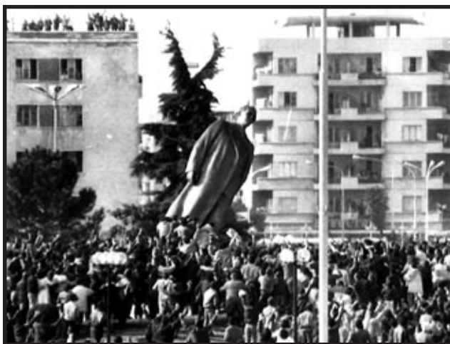
Rušenje Hodžinog spomenika u Tirani, 20. veljače 1991.

Iz toga razdoblja datiraju i famozni bunker u albansku obalu, za slučaj invazije SAD-a na Albaniju, koje se Hodža paranoično plašio. Naime, izgrađeno je oko 750 000 bunkera, svaki za po jednoga čovjeka, koji