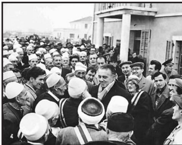
Hodža i narod

Iste 1944. godine, kada se događaju navedeni nesporazumi s Jugoslavijom, dolazi do napredovanja