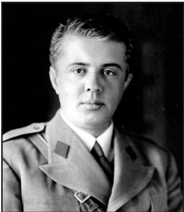
Mladi Enver Hodža

Prezentacija suvremene, a i opće albanske povijesti u okviru hrvatske društveno-javne zbilje, a dobrim dijelom i stručne akademske populacije, svedena je na minimalne informacije. Dobar dio razloga tomu možemo tražiti u samoj ulozi Albanije, koja je gotovo uvijek bila na marginama svjetskih zbivanja, u okviru svjetske povijesti. Tematski okvir ovog broja časopisa bavi se totalitarizmom, a on je u formi komunizma dominirao velikim dijelom suvremene albanske povijesti. Specifičnost albanskog komunizma temelji se na poptunom izolacionizmu, odbacivanju svake primisli na reformiranje staljinističkog tipa vladavine, te striktnom pridržavanju lenjinističko-marksističkog modela upravljanja. Ovdje će slika o totalitarizmu, koji je vladao albanskim društvom praktički četrdeset godina, biti prikazana kroz lik albanskog komunističkog vođe, Envera Hodže, koji utjelovljuje taj totalitarizam.