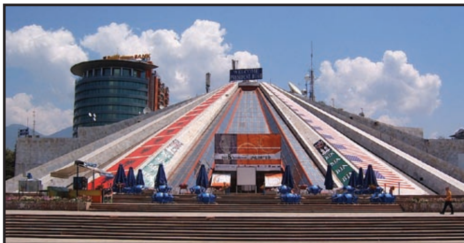
Bivši Muzej Envera Hodže, danas Međunarodni centar kulture, Tirana