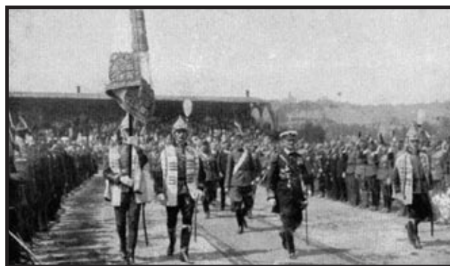
Horthy u Budimpešti, svibanj 1921.

Najvažnija prava koja je Horthy kao regent imao bila su postavljanje i otpuštanje premijera, okupljanje i raspuštanje parlamenta te zapovjedništvo nad oružanim snagama. Iako sam nije donosio zakone, zahvaljujući ugledu i poštovanju koje je uživao te shodno tome i vjernosti (i poslušnosti) ministara koje je imenovao, imao je vrlo značajnoga utjecaja na mađarsku politiku, a sve mu je to bilo zajamčeno ustavom. Prvo desetljeće Horthyjeva upravljanja bilo je obilježeno prvenstveno učvršćivanjem mađarskog novouspostavljenog političkog sustava i gospodarstva, uz pomoć najposobnijeg političara u Mađarskoj u međuratnom razdoblju, Istvana Bethlena, koji je bio premijerom od 14. travnja 1921. do 19. kolovoza 1931. (Unger, 1965: 195.). Iz vladajuće je stranke potisnuo najekstremniju desnicu, uključio najširi srednji sloj, a postigao je i dogovor sa Socijaldemokratskom strankom. Donio je