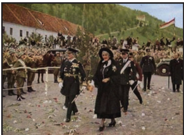
Horthy u Erdelju, neposredno nakon priključenja Mađarskoj

i poništavanjem Trianonskog mirovnog ugovora, 20. studenog 1940. Mađarska postala članicom Trojnoga pakta (Magyar kodeks, 2001: 40.). Nešto prije toga, u prosincu 1939., Mađarska je potpisala sporazum o “vječnom prijateljstvu” s Jugoslavijom. Hitler je iz poznatih razloga odlučio napasti Jugoslaviju i Horthyju je ponudio novo proširenje države, ako se uključi u rat, što je Horthy i prihvatio. Dotada još, naime, zapadni saveznici nisu proglasili rat Mađarskoj, a tada su (krajem ožujka 1941.) poslali diplomatsku notu Telekiju da će to učiniti u slučaju da se Mađarska uključi u napad na Jugoslaviju. Teleki se tome žestoko protivio te je u noći s 2. na 3. travnja izvršio samoubojstvo, pišući Horthyju u svom oproštajnom pismu sljedeće: