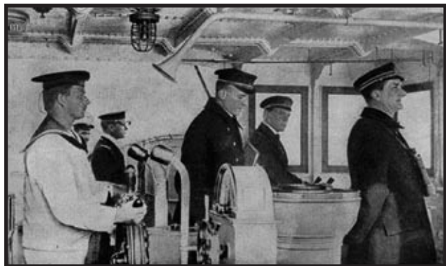
Horthy na zapovjednom mostu "Navare"

Miklos Horthy svoj ratni put započinje zapovijedanjem broda Habsburg, kojim je bio