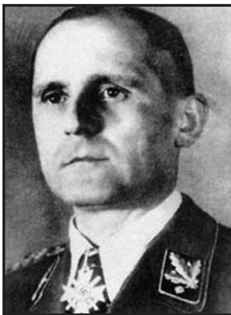
Heinrich Müller - zapovjednik Gestapa i jedan od glavnih arhitekata Holokausta

Tajna služba koja je počinila najviše zločina i koja je bila iznad zakona bio je Gestapo. Gestapo ( Geheime Staatspolizei ) je tajna policija nacističke Njemačke i osnovan je 26. travnja 1933. Njegovo prvo ime činilo je kraticu GPA, što je previše nalikovalo na sovjetski GPU, pa je ime promijenjeno u Gestapo. Gestapo je zbog takozvanih zaštitnih uhićenja i zatvaranja ljudi bio izvan zakona, a istraživao je slučajeve izdaje,