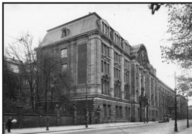
Glavna zgrada Gestapa

metode, metode rasprave, već nove metode, metode za njihovo razbijanje i iskorjenjivanje.” (Overy, 2005: 176) Staljin je stalno isticao važnost zaštite revolucije i stalno se bojao proturevolucije. Tajne službe bile su glavno oruđe u borbi protiv proturevolucionara. Slično Staljinu, Hitler je također naglašavao važnost zaštite njemačke nacije i rase od navodnog biološkog zagađenja i duhovnog propadanja. Provođenje terora držalo je milijune ljudi u strahu. Totalitarne režime 20. stoljeća obilježio je teror provoden među narodima, no ta se represija nikada nije nazivala “terorom”.