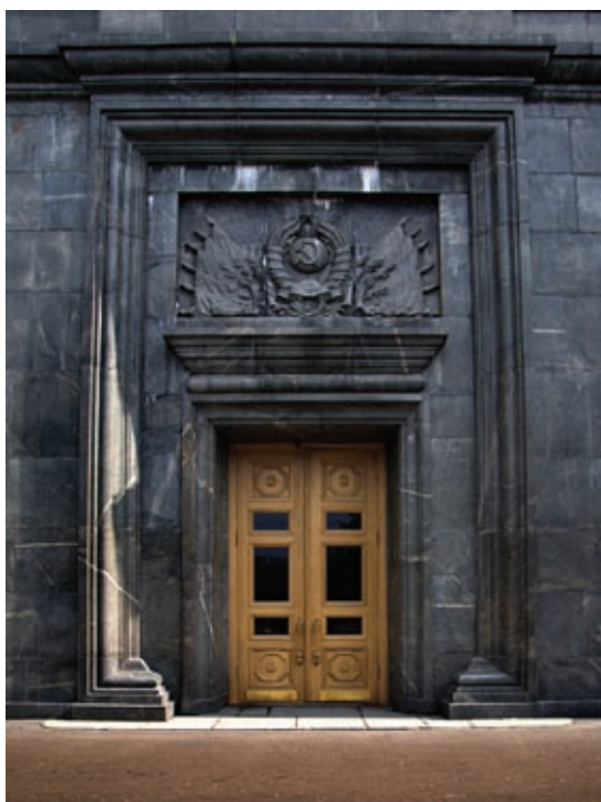
Glavni ulaz zgrade KGB-a u Moskvi

UDBA, "Uprava državne bezbjednosti", služba