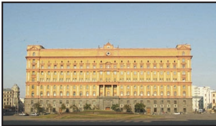
Glavna zgrada KGB-a

njemački narod želio. Obećao je snažnu njemačku naciju koja će se osvetiti za nepravdu iz 1918. Glavnim krivcima neuspjeha iz 1918. Hitler je smatrao Židove i socijaliste, što će uvelike odrediti smjer njegove vladavine. Nakon dolaska na