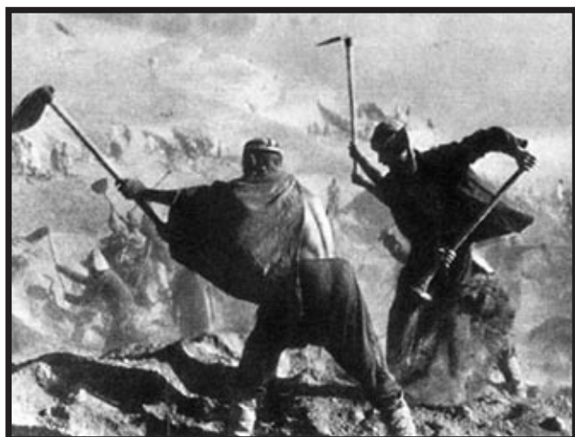
Rad u sibirskom gulagu

masa, propagande i uklanjanja onih koji su smetali vladajućem režimu. Zadaća sovjetskih tajnih službi bila je zaštita revolucije, borba protiv proturevolucije i protiv sabotaže. Prva tajna služba u SSSR-u osnovana je još 1917., a dobila je ime Čeka . Osnovana je radi uhićenja, zatvaranja i likvidacije unutarnjih neprijatelja boljševičke vlasti. Između 1918. i 1920. okrutno se obračunala s ruskim plemstvom, buržoazijom i pobunama u nekoliko velikih gradova. Postavši silom iznad društva, vladinom odlukom reformirana je 1922. godine. Čeku je zamijenio GPU. (Vidušić, 2004: 53) Čeka je kontrolirala radničke logore, likvidirala je političke protivnike i gasila pobune seljaka i radnika, te pobune u Crvenoj armiji. Čeka je bila Lenjinov aparat provođenja terora među stanovništvom i borbe protiv "neprijatelja naroda". Prema Lenjinovim naređenjima provođena su masovna uhićenja i smaknuća ljudi koje je Partija smatrala proturevolucionarima i neprijateljima naroda. Kada se govori o broj žrtava Čeke, spominju se razni brojevi. Najvjerojatnije kako je teror koji je provodila Čeka odnio oko 250 000 života. (Overy, 2005: 180) Čeka je često primjenjivala torturu. Žrtvama je često derana koža dok su još bile žive, a žrtve su bile skalpirane, "krunjene" bodljikavom žicom, nabijane na kolac, razapinjane, vješane, kamenovane do smrti, uranjane u vrelu vodu... Čekisti su polijevali gole zatvorenike vodom po hladnom vremenu i ostavljali ih da se smrznu. Postoje i izvještaji kako su žrtvama