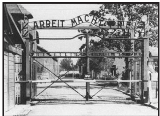
Ulaz u Auschwitz