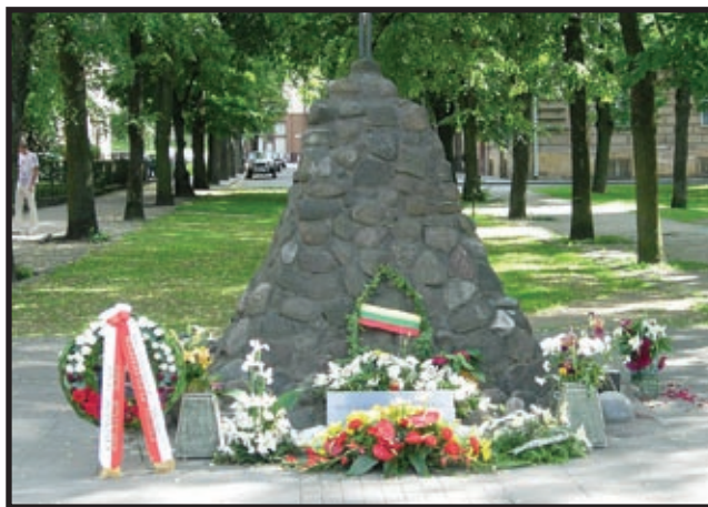
Spomenik žrtvama KGB-a u Vilnius, Litva