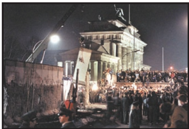
Rušenje Berlinskog zida 1989. godine

Godine 1989. došlo je do rušenja željezne zavjese koja je dijelila svijet na dva bloka. Nestankom komunizma s povijesne pozornice neki su intelektualci vidjeli svijet u potpunosti oslobođen ideologije. Najpoznatiji su Francis Fukuyama sa svojom teorijom o kraju povijesti, te Samuel P. Huntington o sudaru civilizacija. Početak devedesetih godina slobodno bi se mogao nazvati dobom u iščekivanju kraja. Iako je, prema