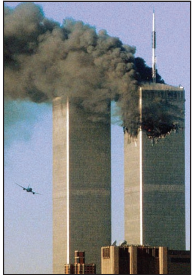
Napadi 11. rujna 2001.

Svijet u kojemu smo svi kafkijanski subjekti koji tražimo svoje identitete.