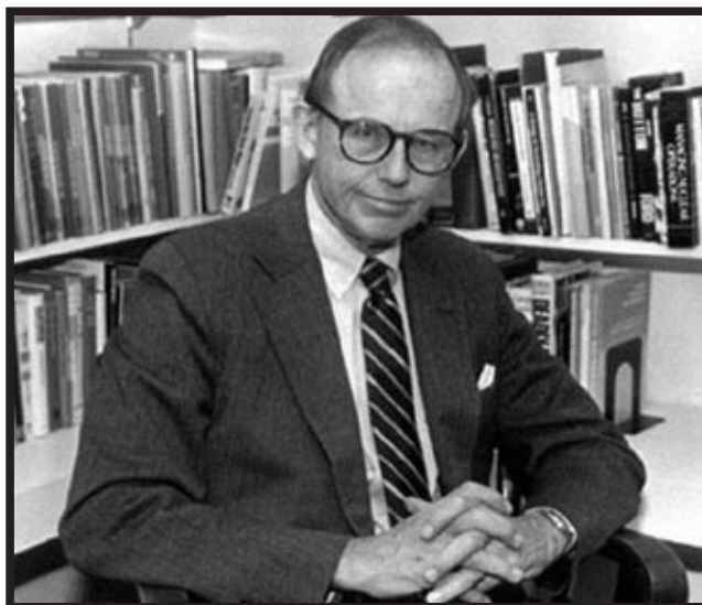
Samuel P. Huntington

Fukuyami, već tada prijeđena barijera onostranosti kraja, taj tzv. "kraj povijesti" se i dalje očekuje. Pod krajem povijesti podrazumijeva se kraj gotovo svega: ideologije, umjetnosti, kulture, građanske klase, kraj velikih pripovijesti itd. Sve ono što je bilo glavnim obilježjem moderne završilo je i postalo je postmoderno. Više ne postoji sukob dvaju ideološki suprotstavljenih blokova. Samuel P. Huntington u svojoj knjizi The Clash of Civilizations govori o sukobu civilizacije na