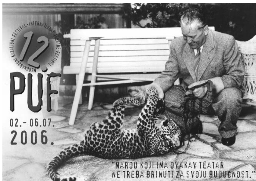
12. PUF, 2006., plakat