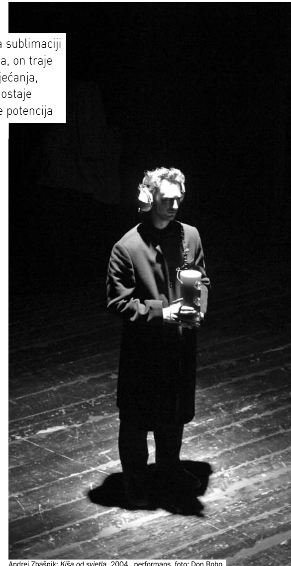
Andrej Zbašnik: Kiša od svjetla , 2004., performans

Nakon ovih dvanaest godina mogu ustanoviti da su se dogodili pomaci i promoviranje medija performansa kroz sustavni rad na njegovu razumijevanju te približavanju široj publici. Primjerice, na određene večeri posvećene mediju performansa došlo je 100, 200, 300 ljudi, što za slične događaje u Puli ili Zagrebu nije slučaj. Također mogu ustanoviti da smo svojim radom približili i promovirali performans u netipičnoj sredini malog grada Pazina i time pomakli centar zbivanja, neposredno doprinijeli demokratizaciji u umjetnosti. Unutar programa, istovremeno kombinirajući afirmirane umjetnike s mladim neafirmiranim, ali i s onima koji još trebaju odlučiti čime će se baviti, istaknuo bih i medijacijsku ulogu umjetnosti koja ne mora nužno voditi profesionalizaciji umjetnika, već otkrivanju potencijala individualaca u drugim područjima kroz kreativan rad i edukaciju.