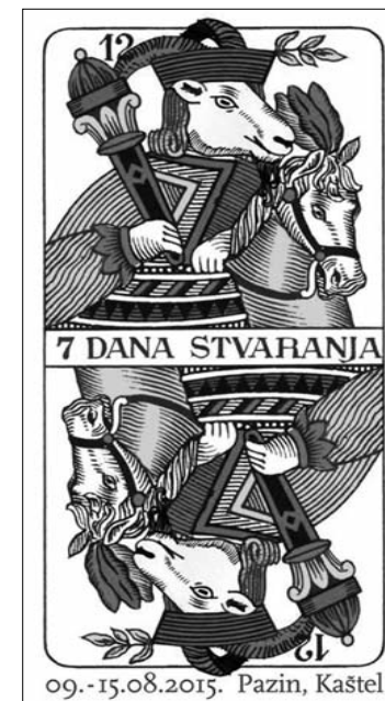
Plakat festivala Sedam dana stvaranja, 2015., autor plakata: Davor Sanvincenti

8. festival Sedam dana stvaranja 2011. u Pazinu – SvejednoIstra