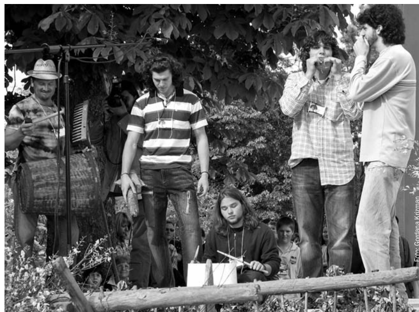
Fešta 'pres' štrumienti

"U nedjelju, 04. svibnja, u Lindaru, nedaleko od Pazina, na trgu ispred crkve sv. Mohora i Fortunata, održan je drugi glazbeni susret Fešta 'pres' štrumienti – susret svirača na neuobičajenim instrumentima. Po cijelom starom gradu Lindaru održavale su se radionice izrade neobičnih instrumenata od prirodnih i industrijskih materijala: sviralice od trstike, švikatići od jasena, a u upotrebi su bile i plastične cijevi, čepovi – kratko sve ono čime je moguće stvoriti zvuk, melodiju, ritam, glazbu. Posjetitelji koji su se okupili u velikom broju mogli su ovdje naučiti kako izraditi priručne instrumente, ali ne samo to, nego su mogli naučiti i zasvirati na tim instrumentima te ih ponijeti kao suvenir. Osim toga, održana je i radionica tradicijskih plesova gdje su zainteresirani posjetitelji učili osnovne korake baluna i potresuljke. A kako za glazbu tu nisu bili potrebni uobičajeni instrumenti, tako tog dana u starom gradu Lindaru nije bio potreban ni sat – vrijeme su odbrojavala zvana sa zvonika župne crkve sv. Mohora i Fortunata, i to svaki puni sat drugačijom melodijom, kampelanjem – znalačkim izvođenjem melodije batom zvana – predstavili su se zvonari iz više mjesta diljem Istre. U prostoru nedaleko od glavnog trga mogle su se pogledati videoprojekcije