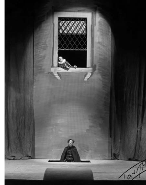
Scena iz predstave Elizabeta Engleska