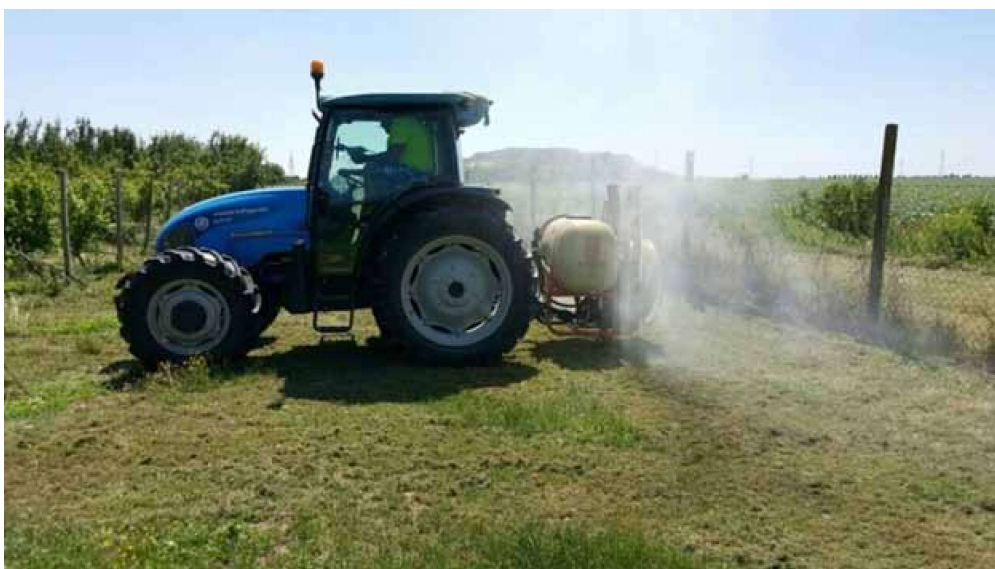
Slika 2. Traktor agregatiran s raspršivačem Picture 2. Tractor aggregated with a axial fan spayer

Uređaj za mjerenje je bio postavljen na sjedište tako da su osi orijentirane na slijedeći način (HRN ISO 2631-4):