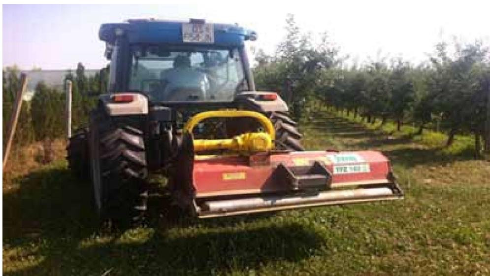
Slika 1. Traktor agregatiran s malčerom Picture 1. Tractor aggregated with flail mower