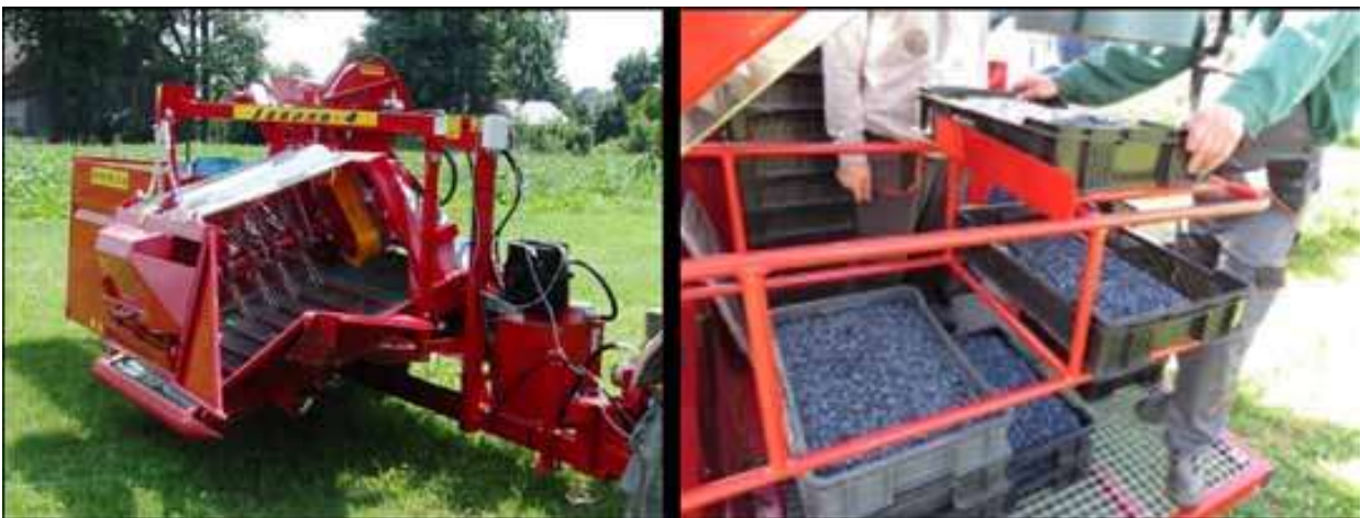
Slika 2. Kombajn Joanna Premium tvrtke Weremczuk FMR

Bočni berač Joanna Premium (slika 2.) vrlo je učinkovit i ekonomičan model koji dolazi s mogućnošću podizanja visokih grana kod berbe grmova visine do 3 m, poput visokogrmolikog bobičastog voća, a osigurava minimalno oštećenje biljke i ploda. Dolazi s trakom za prijenos širine 50 cm i mogućnošću odabira berbe velikog (otprilike 500 kg) ili malog (10 do 20 kg) kapaciteta (Weremczuk FMR Ltd).