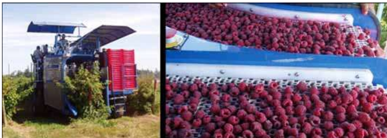
Slika 6. Uporaba kombajna OXBO 9000 u nasadu malina