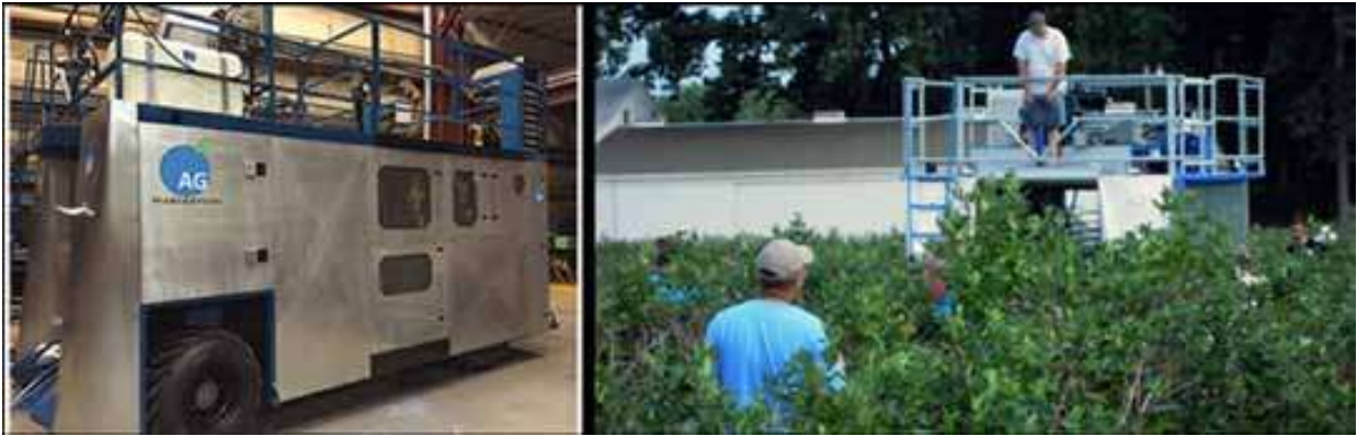
Slika 1. Kombajn berač-jahač AGH 3000 za nasade borovnice