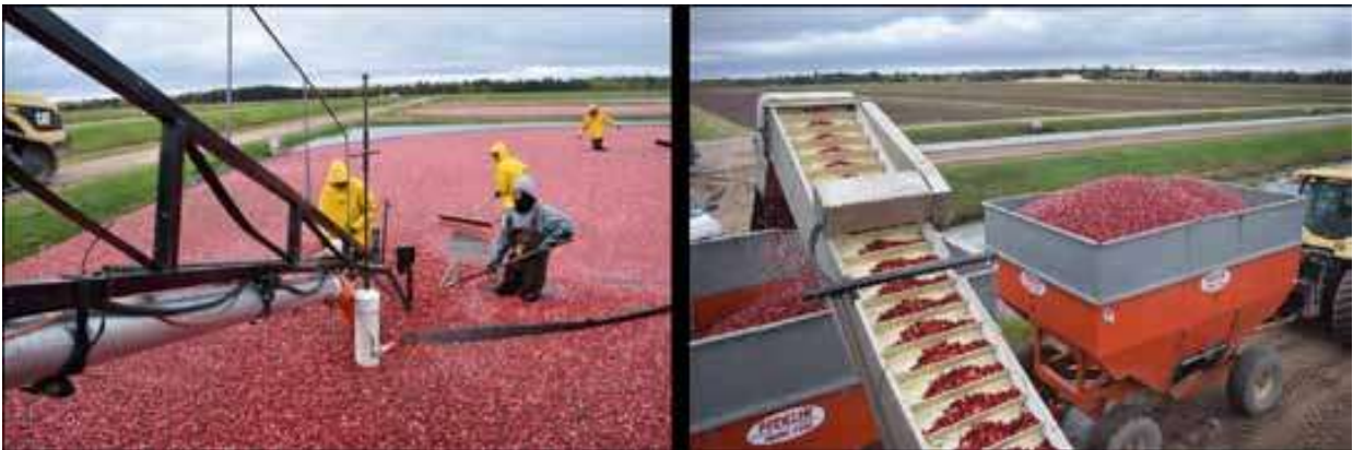
Slika 5. Mokra berba brusnica