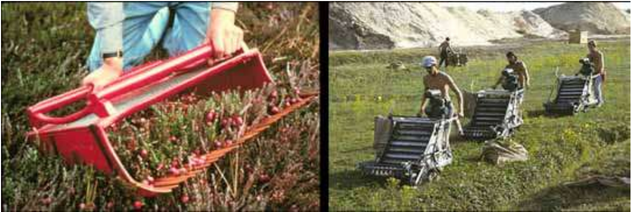
Slika 4. Suha berba brusnica: berba s pomoću ručnih grabilica (lijevo) i ranim modelima strojnih berača (desno) (1982.) u Massachusettsu, SAD