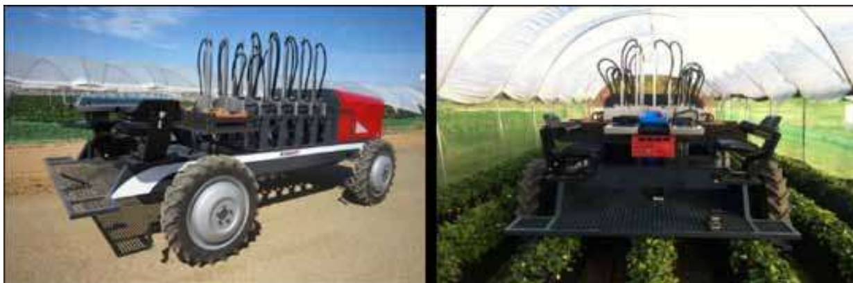
Slika 7. Kombajn ili robotski berač jagoda AGROBOT SW 6010

Jagoda ( Fragaria × ananassa ) je višegodišnja zeljasta biljka iz porodice ruža i jedna od najčešće uzgajanih vrsta jagodičastog voća. Postupak berbe se tijekom vremena nije značajnije promijenio. Osjetljiv plod jagode i danas se bere rukom, iako se u razvijenim državama, osobito za nasade u tunelima ili staklenicima, radi uštede troška radne snage, često primjenjuju i strojni te robotski berači poput navođenog robotskog kombajna za berbu jagoda SW 6010 (slika 7) tvrtke Agrobot. Ovim robotskim beračem upravlja iznimno učinkovit sustav navigacije i navođenja kojim upravljaju automatski sustav upravljanja (AGM) i sustav strojnog vida AGvision®, a omogućuje iznimnu preciznost u berbi isključivo zrelih plodova (Agrobot, 2012.).