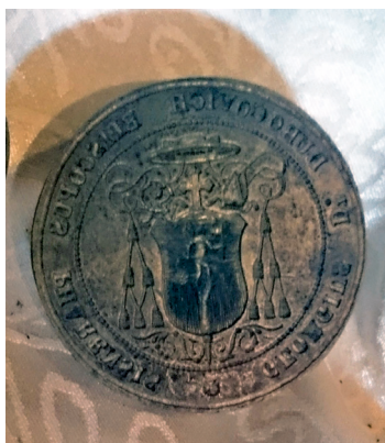
Pečat biskupa Dubokovića, Muzej hvarske baštine