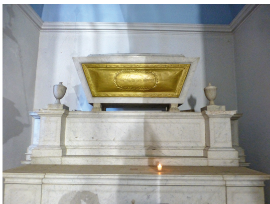
Oltar sv. Vincenca u crkvi Gospe od Spilica u Visu

o statističkom, gospodarskom, trgovinskom i moralnom stanju u Dalmaciji, no ovo je djelo ostalo u rukopisu. 8 Ustanovio je u Hvaru božićnu devetnicu - novenu te osnovao zakladu za održavanje iste.