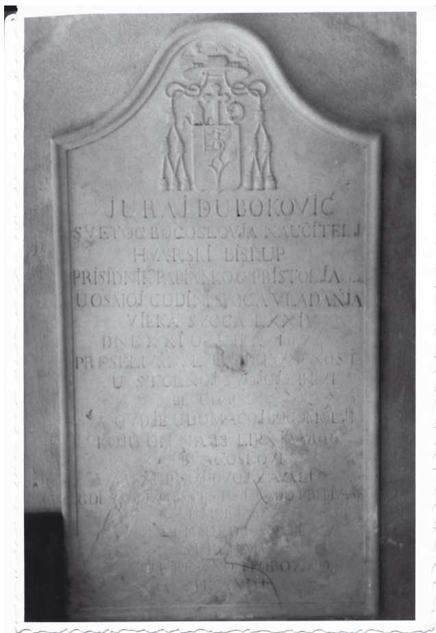
Mramorna stela u obiteljskoj kapeli sv. Margarite u Zavali

U svojih 8 godina biskupovanja Juraj Duboković je ostavio dubok trag u povijesti Hvarske biskupije. Posebne su njegove zasluge na obnovi i gradnji crkava, najčešće o vlastitom trošku, te u brizi za siromašne. Do njegova vremena rijetki su biskupi bili rodom s područja Hvarske biskupija, a s njime započinje vrijeme hvarskih biskupa koji su svi, izuzev Fulgencija Careva, 37 bili s tog područja.