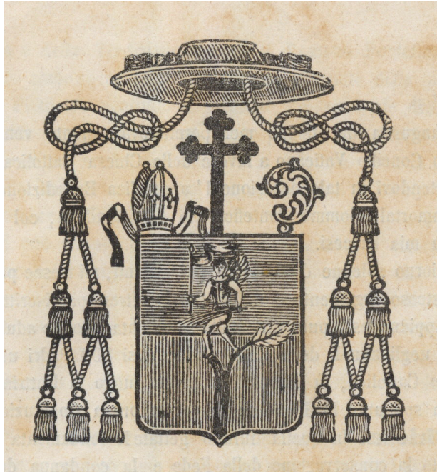
Grb biskupa Dubokovića