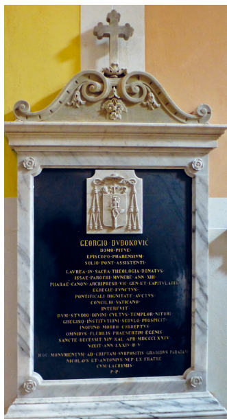
Mramorna stela u kapeli sv. Prošpera u hvarskoj katedrali

istoimenom otoku, te istu posvetivši na spomen bitke, o njenoj sedmoj obljetnici, 20. srpnja 1873. godine. 28