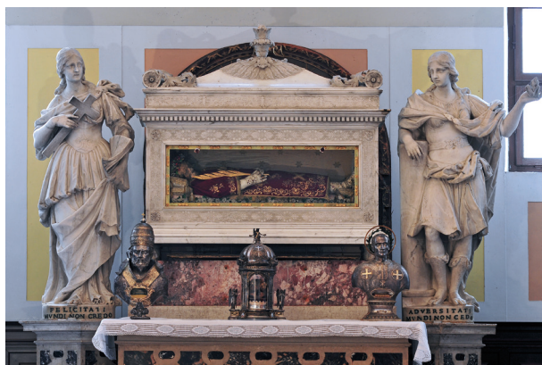
Oltar i srebrni relikvijar-popsrje (desno) sv. Prošpera

Pošto je s uspjehom završio školovanje u Hvaru, Duboković je 1821. otišao na padovansko sveučilište, studij teologije. U Padovi ga je 4. travnja 1825. za svećenika zareadio Carlo Pio Ravasi, biskup Adrije. Na mladoj misi mu je asistirao konventualac o. Angelo Bigoni, njegov prijatelj, u to vrijeme vrlo utjecajan svećenik u Italiji. 4 Do 1827. Duboković je