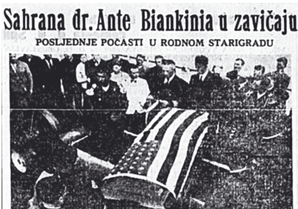
Slika sa lijesom A. Biankinija prigodom sahrane njegovih posmrtnih ostataka u Starome Gradu