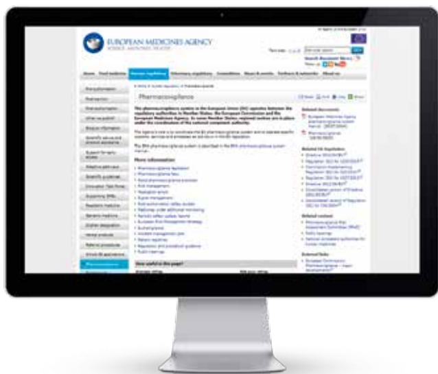
SLIKA 1. Ispis ekrana poveznice na farmakovigilanciju s EMA-ine internetske stranice