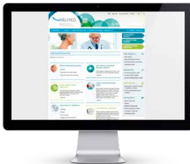
SLIKA 3. Ispis ekrana poveznice na farmakovigilanciju s HALMED-ove internetske stranice