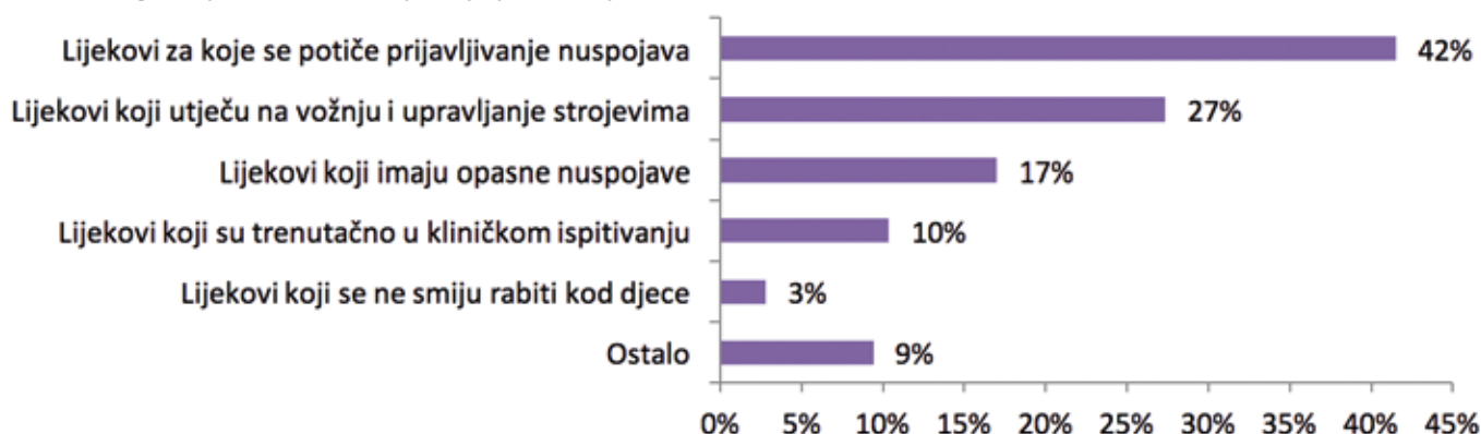
SLIKA 4. Odgovor ljekarnika na pitanje: Koji lijekovi imaju obratni crni trokut?

S druge strane, 27% (29/106) ljekarnika odgovorilo je da se simbol rabi za označavanje lijekova koji utječu na vožnju i upravljanje strojevima.