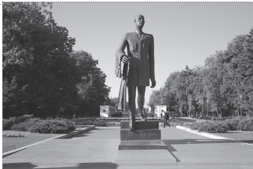
MIRCEA CORNELIU SPĂTARU, SPOMENIK CHARLESU DE GAULLEU, 2006., BUKUREŠT, RUMUNJSKA MIRCEA CORNELIU SPĂTARU, MONUMENT TO CHARLES DE GAULLE, 2006, BUCHAREST, ROMANIA

što ju je totalitaristički režim odbacio ili barem držao u sjeni radi očuvanja kulta ličnosti kakav je bio specifičan za Ceaușescuovu Rumunjsku. Vraćanje sjećanja stoga je prvenstveni cilj društva na području javne umjetnosti, čak i ako njegova nastojanja nisu uvijek trajna i vidljiva na svim razinama. Združivanje prošlosti sa sadašnjošću i ponovno povezivanje vremenskih razdoblja nuždan je korak prema normalnom društvu, a javna umjetnost u tome igra ključnu ulogu. Kako bi se suočilo s očekivanom budućnošću, društvo se počinje sjećati, ponovno pronalazeći svoj ponos, svijest o sebi i identitet. Radi se o zasnivanju budućnosti na prošlosti, ali ne na nacionalnoj i centraliziranoj prošlosti velikih događaja, nego prije na senzibilnijem pristupu povijesti regionalnog i lokalnog karaktera i važnosti.