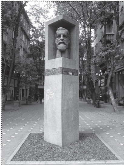
PÉTER JECZA, SPOMENIK KRALJU FERDINANDU, 1998., TEMIŠVAR, RUMUNJSKA PÉTER JECZA, MONUMENT TO KING FERDINAND, 1998, TIMIȘOARA, ROMANIA