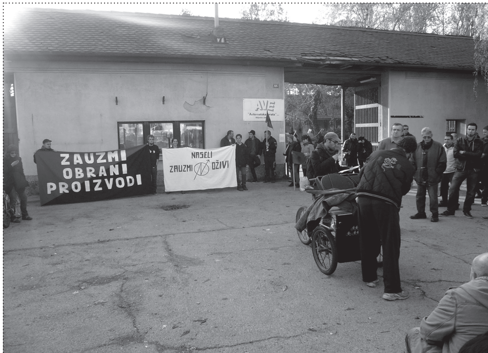
MARŠ SOLIDARNOSTI ZAUZMI, OBRANI, PROIZVODI, ZAGREB, 2012., PREUZETO S: WWW.H-ALTER.ORG SOLIDARITY MARCH CONQUER, DEFEND, PRODUCE, ZAGREB, 2012. SOURCE: WWW.H-ALTER.ORG

Mapa otuđenog (g)rada s jedne je strane samo dokument propalih industrijskih pogona, izgubljenih radnih mjesta, devastirajućih posljedica privatizacijskog procesa, a na kraju i održanog Marša solidarnosti čija je putanja kretanja u nju već upisana. Upisanom putanjom ona sama svjedoči o osmišljenom participativnom karakteru cijele akcije, kojoj je cilj bio upozoriti na rastuće nejednakosti u društvu koje su rezultat sustava u kojem živimo i posljedica nepromišljenih odluka vladajućih.