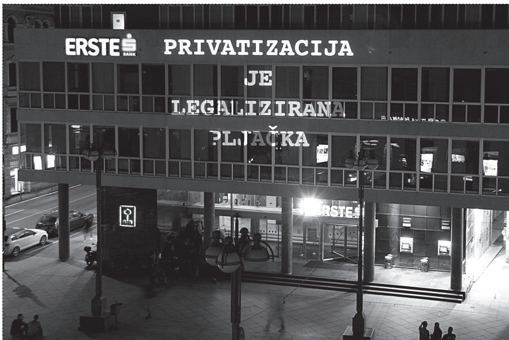
RAFAELA DRAŽIĆ (U SURADNJI S BLOK-OM), AKCIJA BROD = GRAD , RIJEKA, 2013., FOTOGRAFIJA: SAŠKA MUTIĆ RAFAELA DRAŽIĆ (IN COLLABORATION WITH BLOK), ACTION SHIP = CITY , RIJEKA, 2013. PHOTO: SAŠKA MUTIĆ