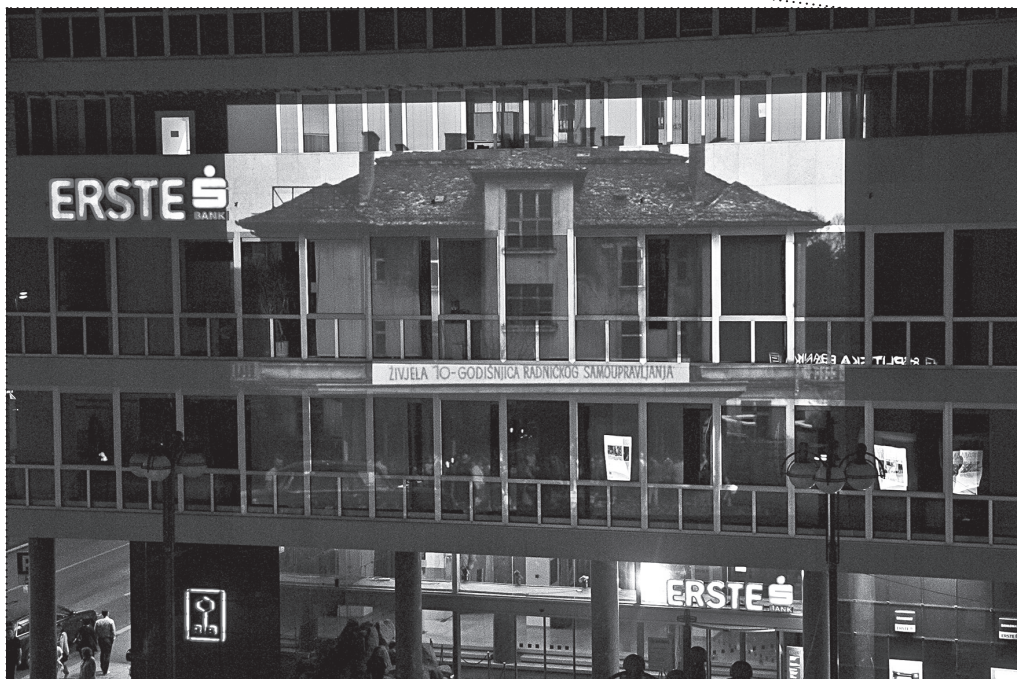
RAFAELA DRAŽIĆ (U SURADNJI S BLOK-OM), AKCIJA BROD = GRAD , RIJEKA, 2013., FOTOGRAFIJA: ANA KUTLEŠA RAFAELA DRAŽIĆ (IN COLLABORATION WITH BLOK), ACTION SHIP = CITY , RIJEKA, 2013. PHOTO: ANA KUTLEŠA