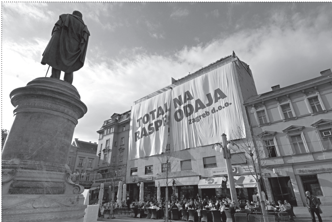
PROSVJEDNA AKCIJA TOTALNA RASPRODAJA, ZAGREB, 2008.