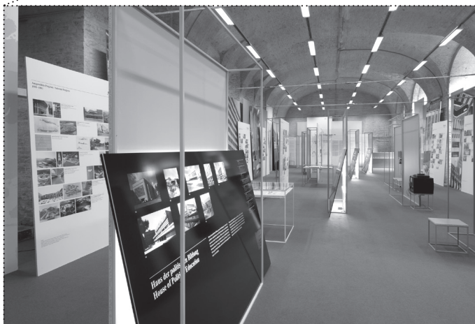
POGLED NA IZLOŽBU SOVJETSKI MODERNIZAM OD 1955. DO 1991. NEPOZNATE PRIČE, BEČ, 2012.-2013. EXHIBITION VIEW SOVIET MODERNISM 1955-1991. UNKNOWN STORIES, VIENNA, 2012-2013.