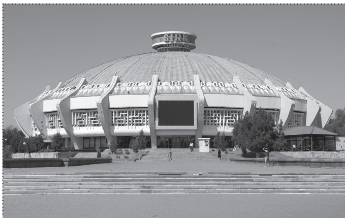
CIRKUS, 1976, TAŠKENT, UZBEKISTAN. ARHITEKTI: GENRICH ALEKSANDROVIČ, GENADIJ MASJAGIN. CIRCUS, 1976, TASHKENT, UZBEKISTAN ARCHITECTS: GENRICH ALEXANDROWITSCH, GENNADI MASJAGIN.