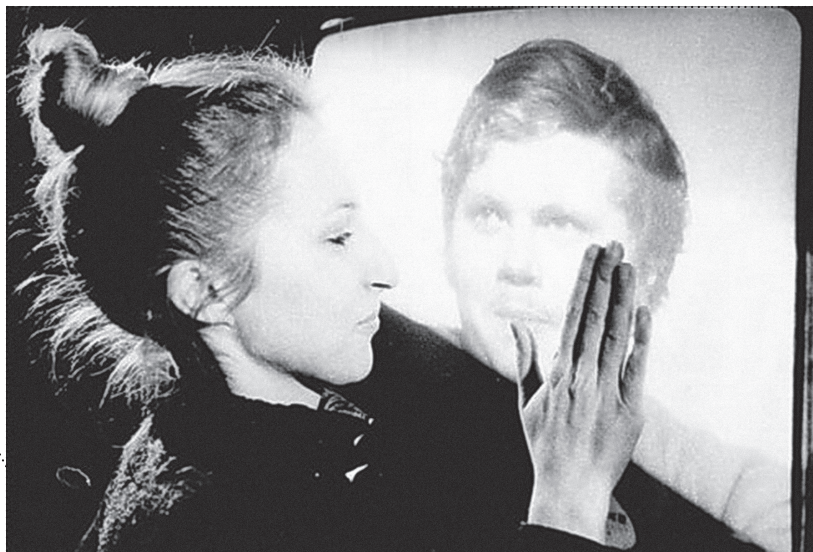
SANJA IVEKOVIĆ, INTER NOS, 1977.

u elektroničkim sustavima (televizija, video, računalo). 13 Prema Šuvakoviću, da bi stvarao artificialni svijet modernog doba i proveo elektroničku estetizaciju stvarnosti, umjetnik preuzima funkcije znanstvenika i inženjera, 14 dok elektronski uređaji postaju produžeci ljudskog tijela. 15 S realizacijama videoperformansa i videoinstalacija povezuje se i termin tehnoperformansa, izvodačkog umjetničkog rada zasnovanog na tehničkim sredstvima realizacije – ekranskom posredovanju djela, ekranskom udvajanju ili posredovanju aktera (tijela, figure), elektronskoj komunikaciji unutar djela te medijskim preobrazbama ljudskog tijela u stroj. 16