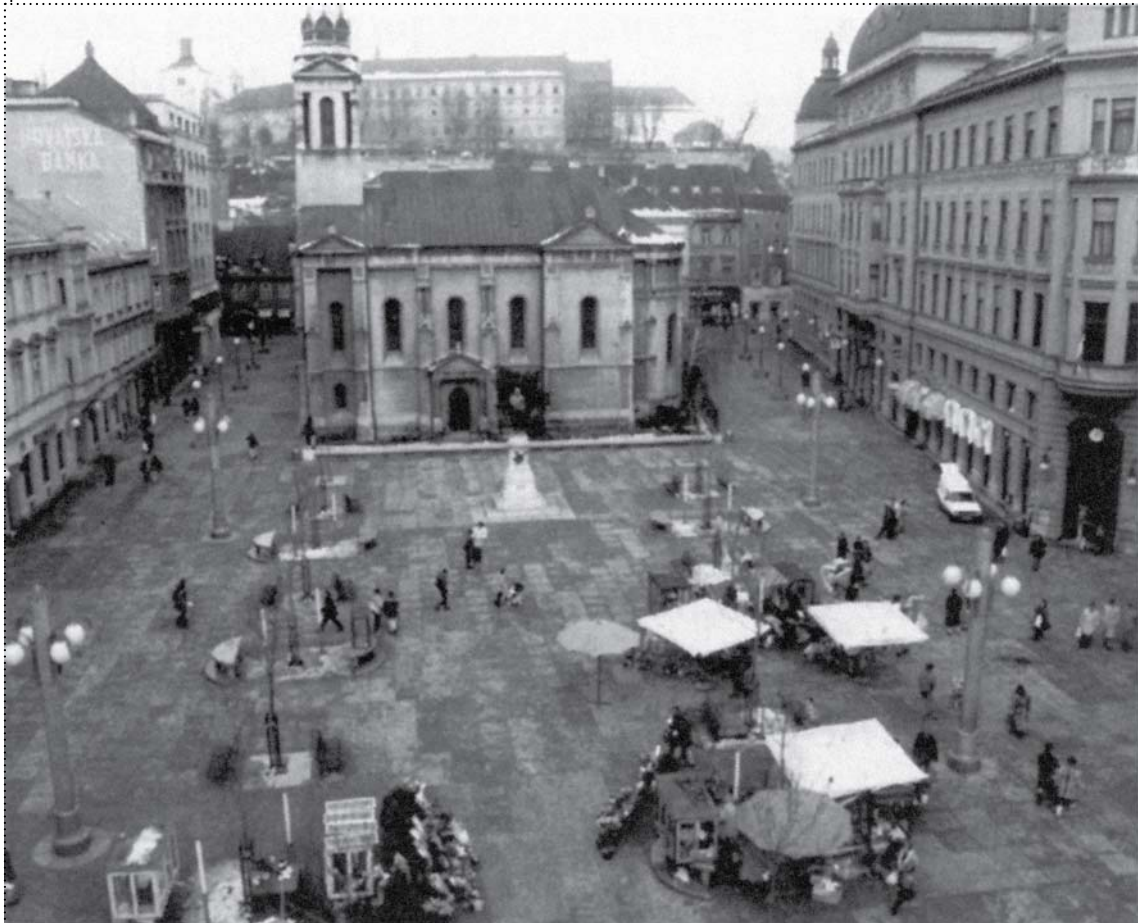
CVJETNI TRG NAKON DEVASTACIJE POD IZLIKOM OBNOVE, 1995.