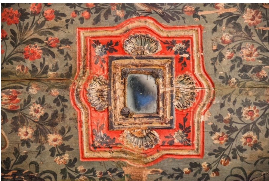
Slika 14. Motiv školjke