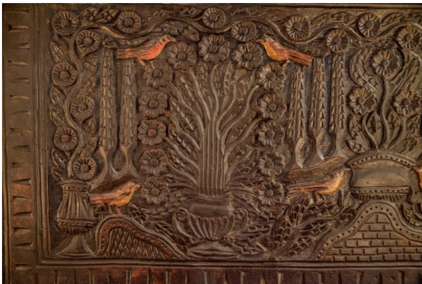
Slika 13. Motiv ptice

Na škrinjama nailazimo i na motiv ptice. Golub u paru sa golubicom, kao simbol ljubavi i slavuj koji zbog svog prekrasnog pjeva simbolizira nedostižnu savršenu ljubav. Nailazimo i na motiv orla koji se uspoređuje s bogom i kraljem jer sve vidi. On je vladarska ptica, simbol duhovnosti i veze s nebom. Orao je ptica svjetlosti, ptica zaštitnik i kao kralj ptica predstavlja viša društvena bića.