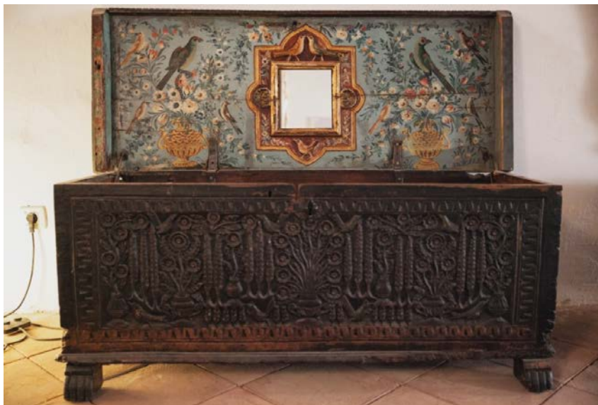
Slika 8. Škrinja jadranskog tipa, 18./19. stoljeće, Dalmacija

Motivi pri ukrašavanju se nanose simetrično i kao primjer navest ću jednu od najljepših škrinja iz fundusa Etnografskog muzeja Split (slika 8.).