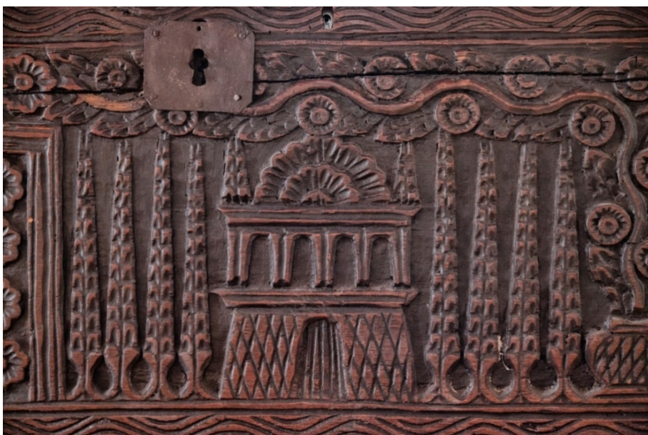
Slika 11. Motiv čempresa

Rezbareni motiv na škrinjama često je bila i kuća koja je mogla predstavljati sliku univerzuma, grad ili hram u središtu svijeta, a također je bila i ženski simbol majke, majčinih grudi i zaštite.