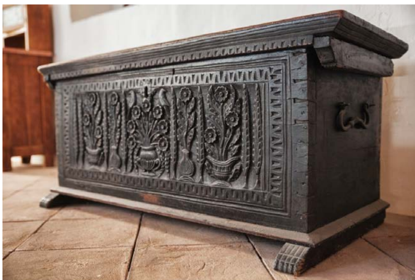
Slika 2. Jadranska škrinja, 19. stoljeće, Dalmacija

od cjelovitih komada drva, a spojene su vezom na pero , odnosno međusobnim nadopunjavanjem zubaca bočnih stranica. Imaju najčešće ravan poklopac i niske nogare. Najčešće se ukrašava prednja stranica rezbarenjem, a poneke su ukrašene oslikavanjem unutrašnje strane poklopca. Najčešći motivi su stilizirane vaze ili košare sa cvijećem, ptice, čempresi, razni geometrijski motivi. Ovaj tip škrinja naziva se još i primorskim tipom (Han, 1960/1961:5). Osim bogato ukrašenih škrinja, postojale su i škrinje sa skromnijim ukrasima kao jednostavni cvjetni motivi na jednoj od stranica škrinje, a također su postojale i one bez ukrasa koje su služile kao spremnice za brašno ili neku drugu hranu. Jadranski tip škrinja bio je vezan pretežno za obalno područje, ali su terenska istraživanja pokazala rasprostranjenost jadranskog tipa škrinja i u unutrašnjosti, samo u nešto skromnijim varijantama (Vojnović Traživuk 2010:6).