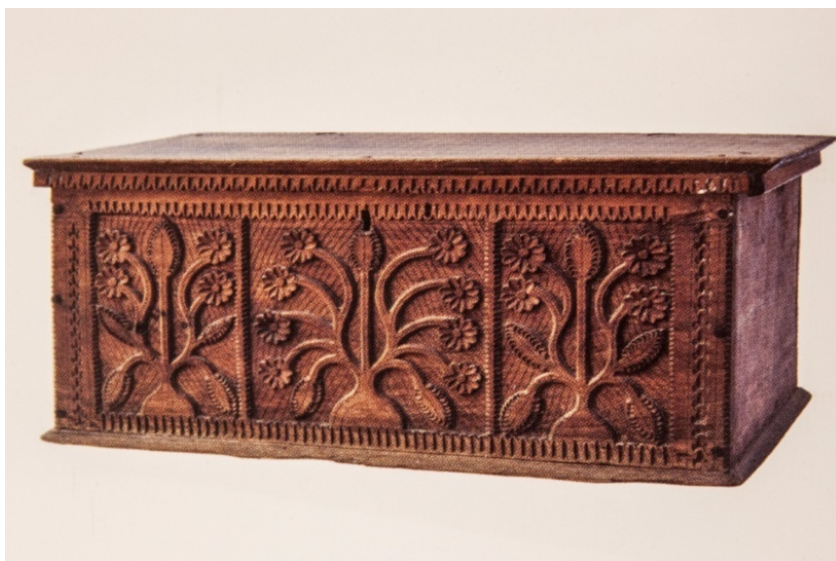
Slika 3. Dinarska škrinja, 19/20. stoljeće, Dalmatinska zagora

su rezbareni geometrijski i biljni oblici, rozete te varijacije drva života (Vojnović Traživuk 2010:7).