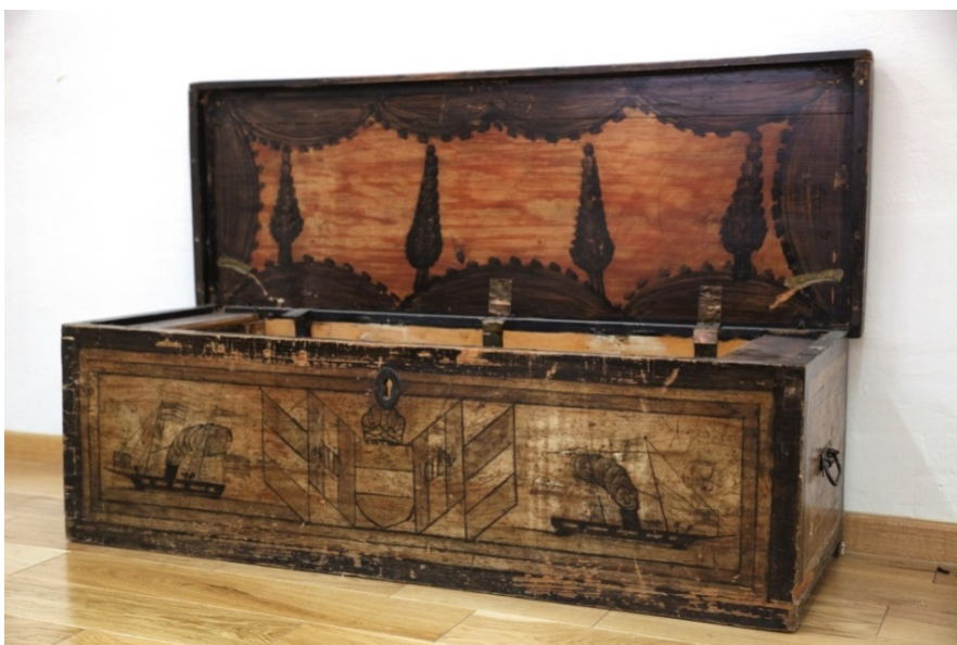
Slika 4. Pomorska škrinja, 19. stoljeće, Orebić na poluotoku Pelješcu