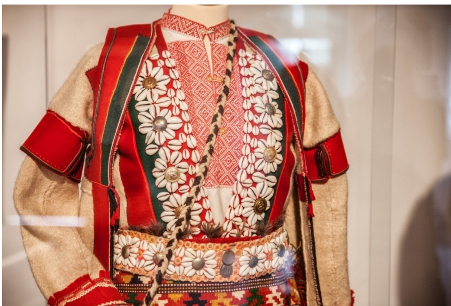
Slika 15. Školjke na vrličkoj ženskoj nošnji