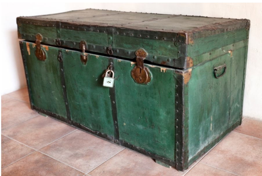
Slika 5. Putni kovčeg, početak 20. stoljeća, Split