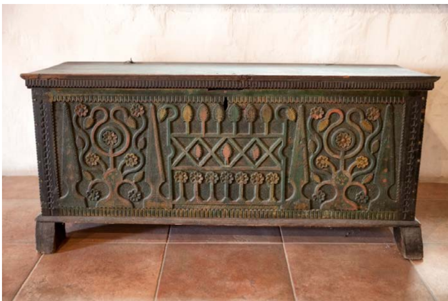
Slika 7. Škrinja jadransko-dinarskog tipa, početak 20. stoljeća, Hercegovina