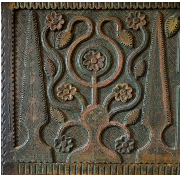
Slika 9. Motiv drva života

Motiv vaze sa cvijećem ima i simbolički smisao i kao motiv na škrinjama nije izabran nasumično. Na prikazima Navještenja od 13. stoljeća prikazuje se cvijet u vazi, a u našoj tradicijskoj kulturi često se tumači kao drvo života. Osim kao ukras na škrinjama drvo života možemo pronaći i na nekim muškim haljecima.