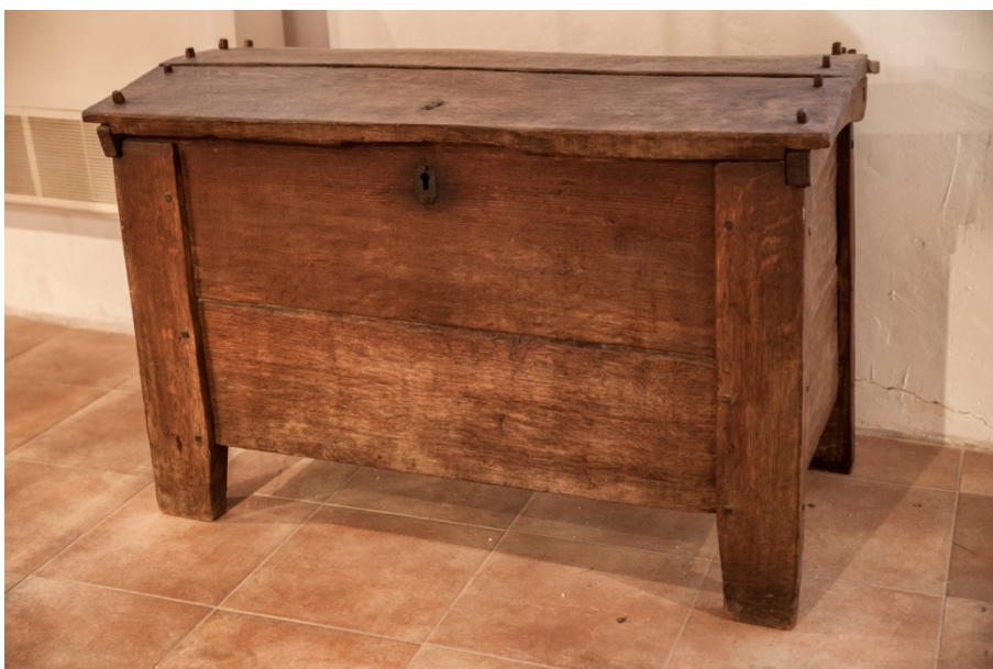
Slika 6. Ambar, početak 20. stoljeća, okolica Sinja