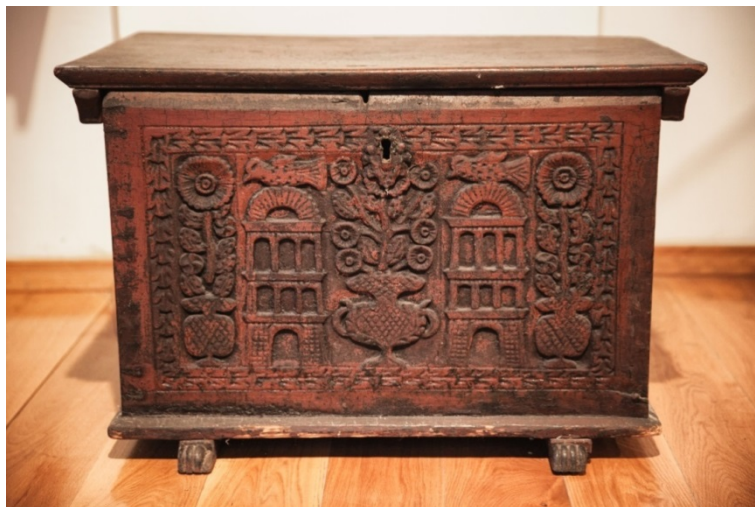
Slika 12. Motiv kuće

Rezbareni motiv na škrinjama često je bila i kuća koja je mogla predstavljati sliku univerzuma, grad ili hram u središtu svijeta, a također je bila i ženski simbol majke, majčinih grudi i zaštite.