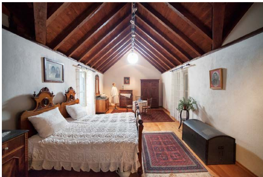
Slika 1. Pučka soba s kraja 19. i početka 20. stoljeća

Iako ih je u prošlosti posjedovala svaka kuća škrinje su s vremenom izgubljene ili uništene, a tek neke su ostale sačuvane u muzejskim zbirkama (Fazinić 2003:189).