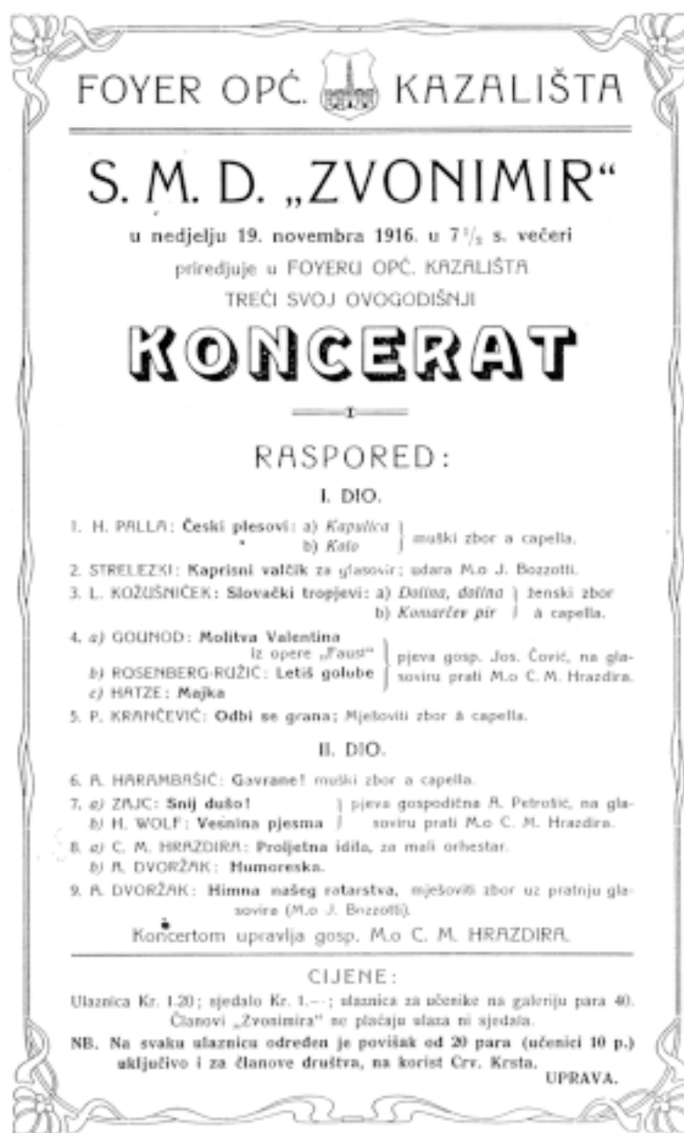
Sl. 4: Programski list koncerta »Zvonimira« od 19. studenoga 1916. godine