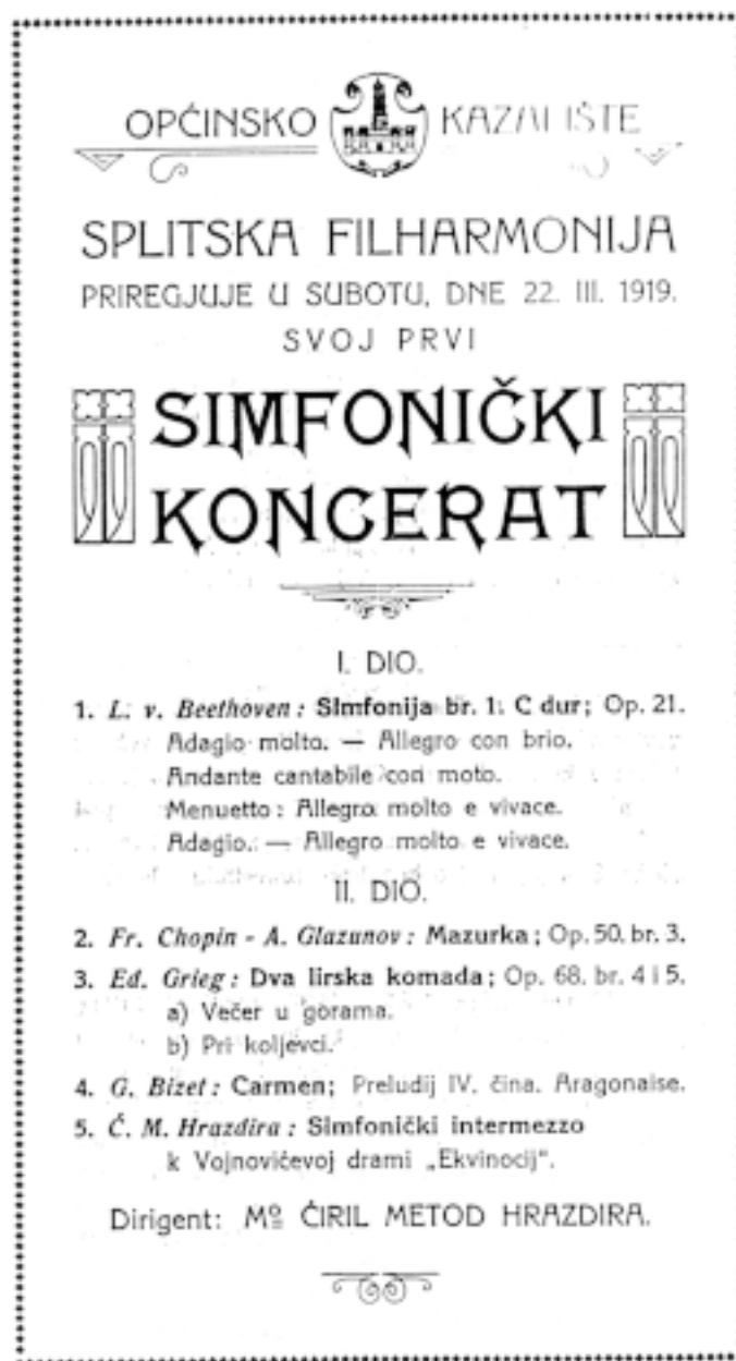
Sl. 6: Programski list prvog koncerta Splitske filharmonije od 22. ožujka 1919. godine