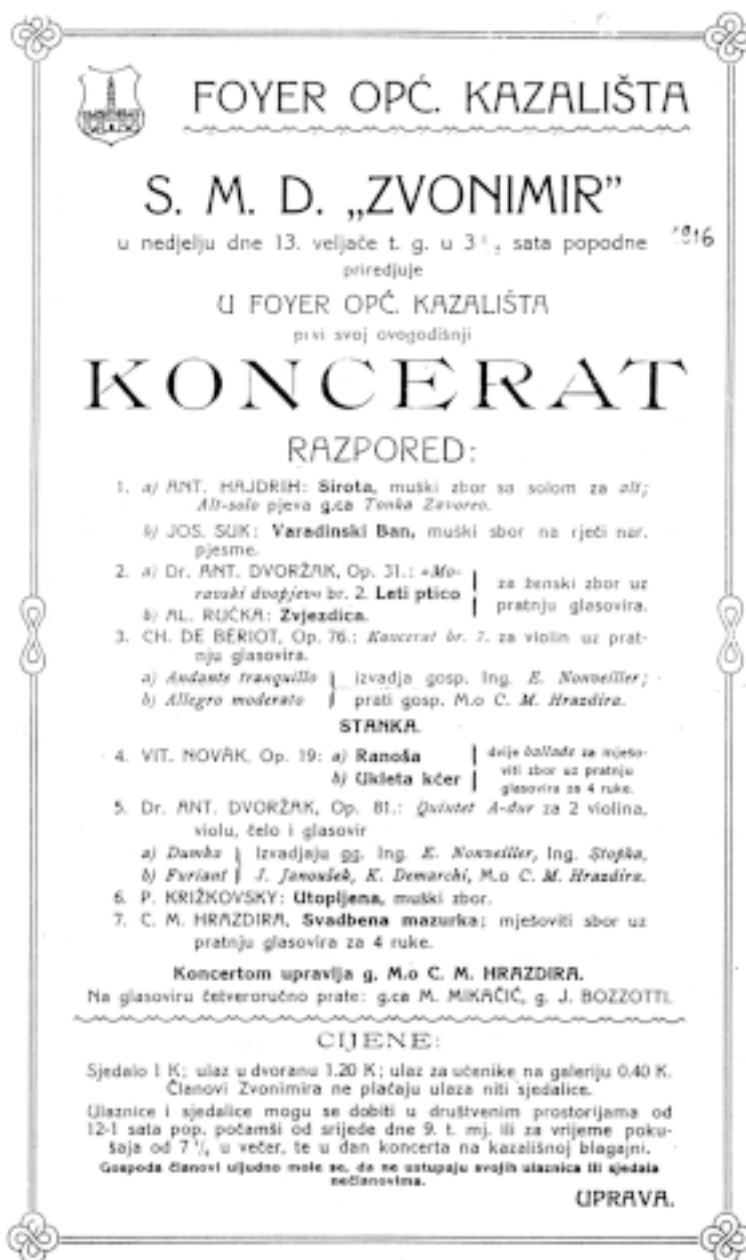
Sl. 3: Programski list koncerta »Zvonimira« od 13. veljače 1916. godine