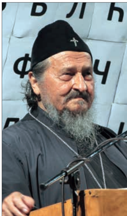
Slika 1. Vladika Atanasije Jevtić