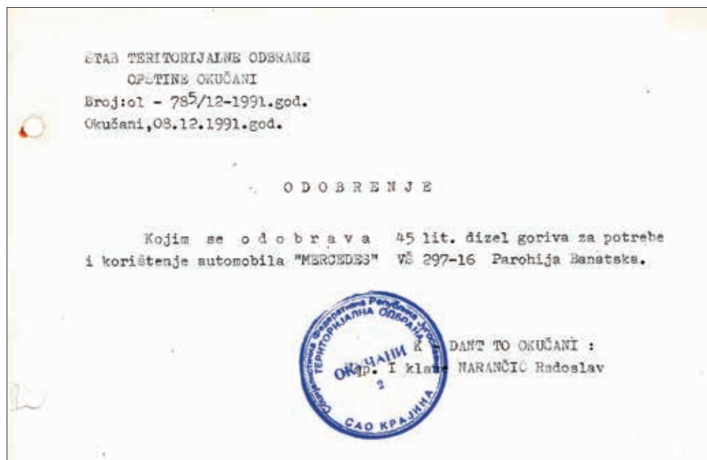
Slika 3. Odobrenje Štaba TO Okučani vladiki Atanasiju za 45 litara dizel-goriva za automobil za povratak u Srbiju

U potpisu stoji: episkop banatski Atanasije i episkop slavonski Lukijan. 1039 Nakon obilaska Posavine vladika je 8. prosinca od Štaba TO Okučani dobio 45 litara dizel-goriva koliko mu je trebalo za „Mercedes“ za povratak u Beograd preko Banje Luke. 1040