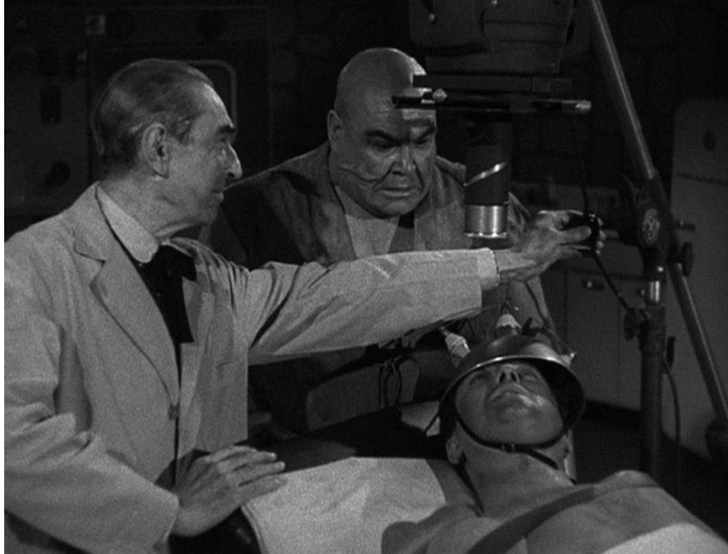
Slika 5. Kadar iz filma Bride of the Monster ( Nevjesta čudovišta , 1955.), redatelja Edwarda D. Wooda mlađeg. 35