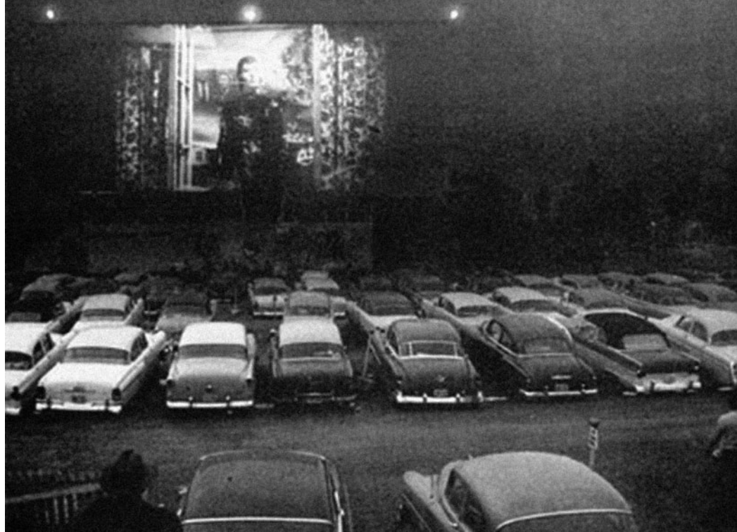
Slika 4. Starlite drive-in kino u Chicagu, sredina 1950-ih. 28

nekoliko kinodvorana tijekom različitih vremenskih ciklusa. Nasuprot tome, nezavisne kompanije bi počele sa simultanim prikazivanjem svojih filmova u mnogo dvorana. Nezavisni filmaši su reklamirali svoje filmove na televiziji, a distribuirali su ih i tijekom ljeta, koje se tradicionalno percipiralo kao doba slabe zarade. Kao što smo prije naglasili, filmovi bi u drive-in kinima premijerno krenuli s prikazivanjem kasnije negoli u gradskim. Međutim, nezavisni poduzetnici počeli su premijerno prikazivati svoje filmove i u drive-in kinima. Sve ove inovacije s vremenom su prihvatile i velike kompanije. 33 Neki filmaši bili su posebno maštoviti, osmislivši razne atrakcije kojima bi privukli publiku. Redatelj i producent William Castle prihvatio je način snimanja i promocije horror filmova karakterističan za Rogera Cormana i ostale AIP-ove djelatnike, pri čemu ih je obogatio svojim trikovima. Tako su tijekom projekcija njegovog filma House on Haunted Hill ( Kuća na ukletom brdu , 1959.) ljudski kosturi iskakali iz zidova dvorane i plesali iznad glava gledatelja. Za potrebe filma The Tingler ( Strujotres , 1959.), Castle je ugradio vibratore u sjedala koji bi se aktivirali tijekom projekcije, tako da su gledatelji imali osjećaj kako ih je potresla struja. 34