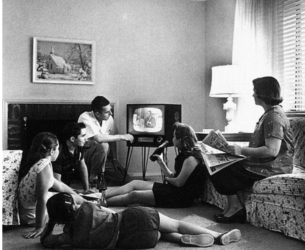
Slika 2. Obitelji zajedno gleda televiziju, 1958. godina. 22

neizoštrena i crno-bijela. Veliki filmski studiji su gotovo u potpunosti prekinuli produkciju crno-bijelih filmova s malim troškovima i koncentrirali se na manji broj filmova s velikim troškovima. 23 Poduzetnici su promjenom izgleda i zvuka svojih filmova nastojali odvojiti gledatelje od udobnosti dnevnih soba i privući natrag u kina. Boja je bila važan faktor kojim su filmaši nastojali konkurirati televizijskoj crno-bijeloj slici. Tijekom ranih 1950-ih godina hollywoodska proizvodnja filmova u boji skočila je sa 20% na 50%. Mnogi su za bojenje filmova koristili vrlo kvalitetni Technicolor, koji je usavršen još 1930-ih godina. Godine 1950. nastao je Eastman Color, postupak bojenja koji je bio mnogo lakši za upotrebu. Jednostavnost Eastmana omogućila je veću proizvodnju filmova u boji. Osim boje, velika prednost kina nad televizijom bila je i širina ekrana. Između 1952. i 1955. godine nastali su mnogi procesi proizvodnje filmova širokog ekrana, poput Cinerama, CinemaScopea i VistaVisiona. 24 Prvi film snimljen u CinemaScopeu, The Robe ( Tunika , 1953.) redatelja Henryja Kostera, potukao je rekorde, postavši film sa najvećom zaradom u povijesti. 25 Zvuk je bio još jedan element kojim se nastojalo privući publiku. Tijekom ranih 1950-ih godina filmski studiji zvuk su snimali na magnetskoj vrpici, koja je zamijenila dotadašnju optičku. Naravno, sve ove tehnološke inovacije prisilile su vlasnike kinodvorana na preuređenje i osuvremenjivanje.