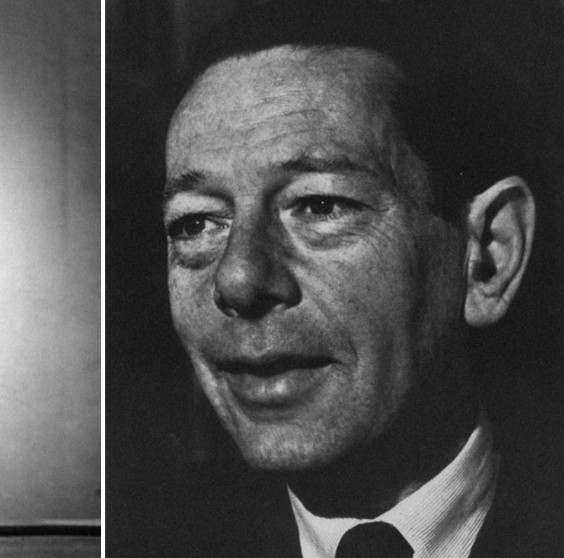
slika 2. Edward Crankshaw – službeni portret

pronalazi i više nego odgovor kako je pala Monarhija: on otkriva misiju i ideju stare Austrije, i pronalazi je čak i nakon samog sloma 1918., u Jugoslaviji i Čehoslovačkoj, a posebice u Titovoj novoj državi. 16 Kao kritičar stare Europe, povjesničar koji je s prijezirom gledao na Metternichov konzervativizam i osuđivao novi poredak iz 1919. Taylor u gotovo svakom potezu austrougarske vlasti vidi ili put ka propasti ili samo privremeno odgađanje neizbježne sudbine. Poput Taylora, i Crankshaw u propasti Monarhije pronalazi i korijene krize Europe uoči rata s Hitlerom. Tako je Crankshaw u svojevrsnom programatskom uvodu svom djelu napisao: „Habsburška monarhija je izbrisana i uglavnom zaboravljena. Problemi koje je pokušala riješiti su je nadživjeli: i danas nas prate.“ 17