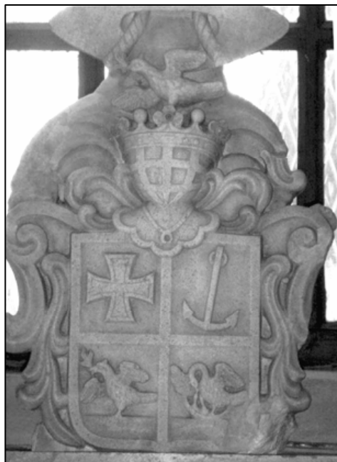
Sl. 2. Kameni grb biskupa Ježića s nadgrobnog spomenika (Crkva sv. Filipa i Jakova u Novom Vinodolskom)

U muzeju Sakralne baštine (zbirka kamenih grbova) u Senju nalazi se kameni grb biskupa Ježića koji se razlikuje od njegovih ostalih grbova, a svi imaju samo jedan zajednički lik – malteški križ.