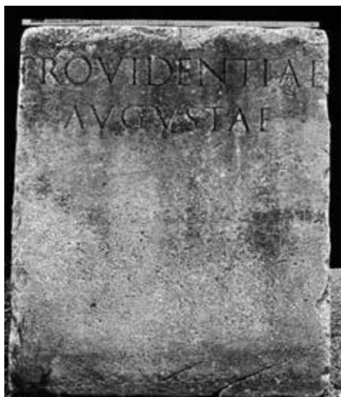
Slika 5 Posvetni natpis iz Julije Konkordije (EDH)

Konkordije Sagitarije dosta je sličan i natpis na žrtveniku iz Ternija u Umbriji (rimski Interamna ) koji je dulji samo za jednu riječ i glasi: Providentiae / Augustae sacr(um) (CIL 11/2 4171).