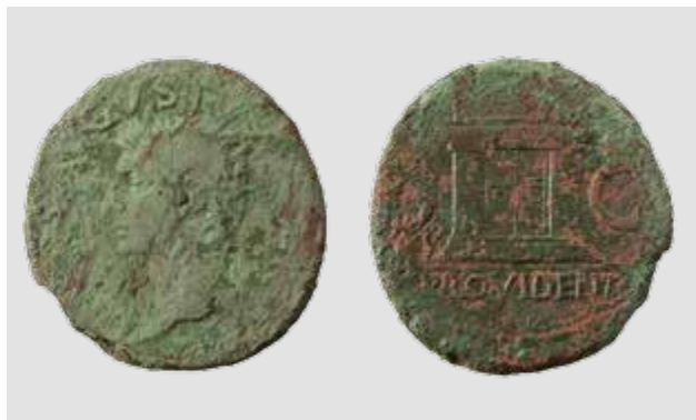
Slika 2 Avers i revers asa Providentia serije iz Burna