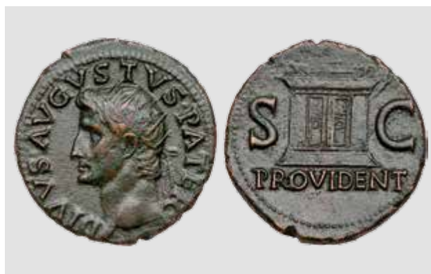
Slika 3 Avers i revers odlično očuvanoga asa Providentia serije ( http://www.coinarchives.com/89cf41c0f367110e31c54653d5ea7d91/img/goldberg/098/image02225.jpg )

Zaključno se smije ustvrditi da je sigurno posrijedi prikaz aversa i dijela reversa jedne od prethodno opisanih kovanica, jer je gotovo beznačajna mogućnost da je Cirijak bio te sreće naletjeti na nekakvu brončanu reljefnu ploču s Augustovim prikazom i još k tome s posvetnim natpisom identičnim legendama na novcu! Mogućnost da se takav komad sačuvao do početka 15. stoljeća bila bi ravna znanstvenoj fantastici. Različiti stav oko dvojbe »natpis ili novac« ogleđa se i u tri glavne epigrafičke baze latinskih natpisa: dok »natpisa« nema u poznatoj Epigraphische Datenbank Heidelberg (EDH) ni u bazi podataka Lupa, Epigraphik-Datenbank Claus-Slaby (EDCS) ga donosi pod brojem EDCS-65000046! Suradnici u EDH i Lupi po tom pitanju očito su ozbiljniji i slijede velikoga Th. Mommsena. On je naime na početku trećega sveska CIL-a, unutar poglavlja Inscriptiones falsae vel alienae , pod brojem 176* donio komentar uz Cirijakov problematični navod i tamo naveo: »Cirijak u komentaru uz br. 154 na otoku Visu piše da je vidio bakreni novac s natpisom DIVUS . AUGUSTUS . PATER . PROVIDENT, koji ne bi trebao biti donijet između natpisa« (slobodniji prijevod djelo je potpisnika ovih redaka). 10