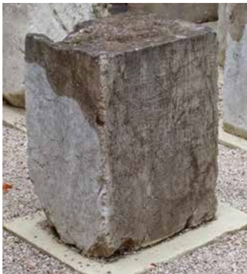
Slika 4 Baza kipa sacerdote Kalikrateje iz Korinta (EDH)

Dva natpisa potječu iz Korinta (provincija Ahaja) i zanimljivo je da su istoga sadržaja, osim u dijelu gdje se navode glasački okruzi čiji su ih predstavnici podigli. Na prvome iz samoga Korinta (HD025948) stoji: Callicrateae / Philesi fil(iae) / sacerdoti in perpet(uum) / Providentiae Aug(ustae) / et Salutis publicae / tribules tribus Agripp[ia]e / bene meritae (restitucija prema EDH). 12 S obzirom na dimenzije bloka na kojemu se natpis nalazi (vis. 0,715, šir. 0,525 i deb. 0,42 m), izrađena u formi okomito izdužena kvaderna pravilnih stranica (sl. 4), po svoj je prilici riječ o bazi počasnoga kipa Kalikrateje, Filesove kćeri, koja je, kao što vidimo iz teksta, doživotno obnašala funkciju sacerdote (svećenice) kulta