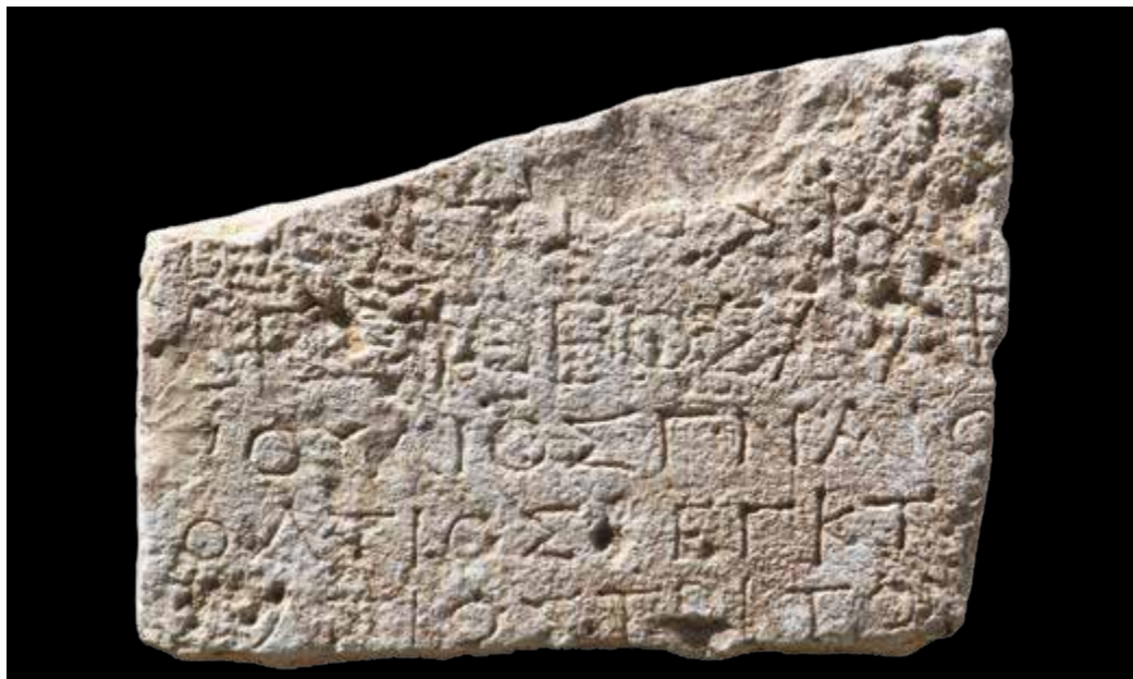
Slika 1 Natpis iz Visa

slova, a u gornjem dijelu fragmenta naziru se donji dijelovi slova još jednog retka. Zbog fragmentarnosti se ne može ustanoviti originalan broj redaka. Visina slova varira od 10 do 14 mm. Donja tri retka uklesana su uredno i pravilno, a gornja dva daleko nemarnije i nepravilnije, te je očito da je tekst uklesan u dva navrata. Čini se posve mogućim da su gornja dva retka kasnija, iako se ni obrnuti redosljed ne može isključiti. Spomenik je vjerojatno nadgrobni, jer je na njima uobičajeno naknadno dodavati imena novih pokojnika. Manje je vjerojatno da bi počasni ili zavjetni natpis nastao u dva navrata ili da bi ga u jednom navratu klesala dva klesara. Nadgrobni je natpis ujedno i jedina vrsta natpisa na kojoj bi se i iznad uklesanih imena mogao ostaviti prazan prostor u koji bi kasnije stala nova imena. Praksa više imena na jednoj nadgrobnoj steli i klesanje u više mahova u Isi je vrlo dobro potvrđena te se ovaj spomenik u nju posve uklapa. 8