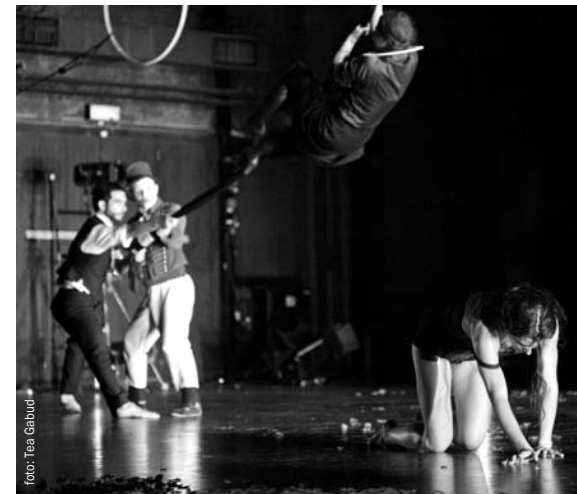
Ki Omos Kinetai, IL paRRaiso

◀ Cirk La Putyka, Slapstick Sonata , foto: Siniša Glogoški