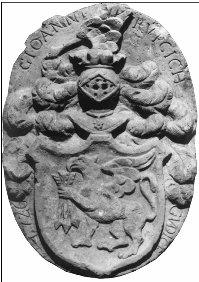
Sl. 1. Grb Rubčića – Rupčića iz Korjenić – Neorićevog grbovnika iz 1595. godine.

Za vrijeme Kandijskog rata Rubčići-Rupčići se iz Hercegovine masovno iseljavaju u okolicu Imotskog, u mjesto Lovreč, gdje i danas žive, a jedan dio u potrazi za sigurnošću odlazi prema moru, pa se tako nalaze i u zaleđu Splita među mnogobrojnim doseljenicima, koji su zbog vlastite sigurnosti morali napustiti Hercegovinu i doseliti se u sigurnije krajeve.